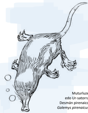
Muturuze edo Ur-satorra Desmán pirenaico Galemys pirenaicus