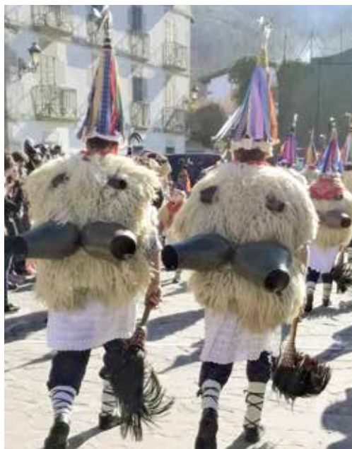
2. irudia. Iturengo joaldunak.

Egiaztatzen ahal izanen ote dira noizbait?