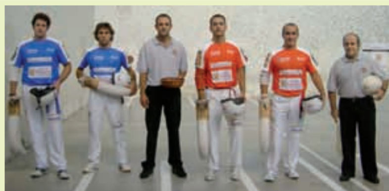
ARGAZKIA ETA TESTUA: MAITE OTEJUA

Baztan mundu bat. Mundu anitz Baztanen lelopean giro ederrean joan zen irailaren 19an Bidelagun elkarteak antolatutako kultur ezberdinen arteko eguna.