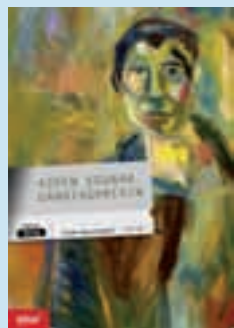
Azken egunak Gandiagarekin