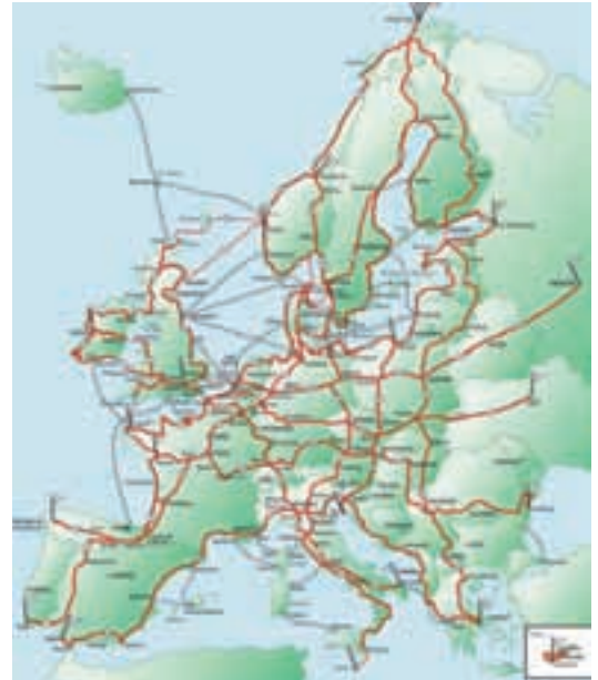
Europa osoan barna pasako diren 12 bideak honela diseinatuak ditu Europako Txirrindularien Federazioak.

bultzatuta, Noruegako lurmuturretik Portugalera doan Eurovelo txirrindularientzako ibilbidea eskualdetik pasako da: Endarlatsatik Iruñera bidean, Bortzirriak, Sunbilla, Doneztebe, Saldias... zeharkatuz.