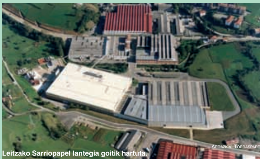
Leitzako Sarriopapel lantegia goitik hartuta.