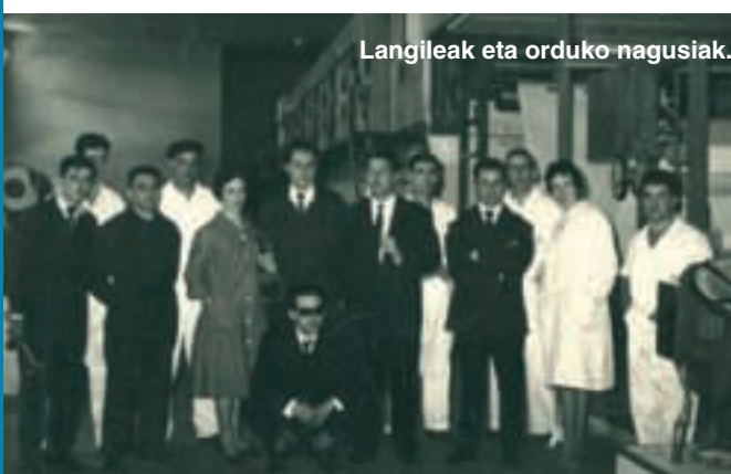
Langileak eta orduko nagusiak.