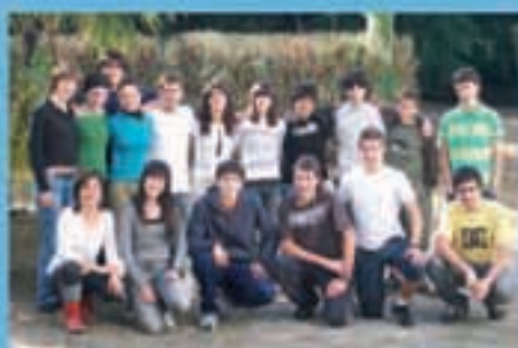
TOKI ONA Institutua Tel. 948 625 000