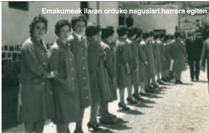
Emakumeak ilaran orduko nagusiari harrera egiten.