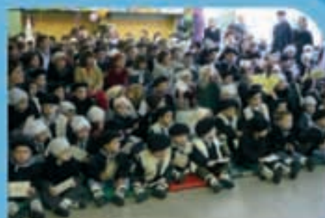
Bera: Ricardo Baroja E.P. Tel. 948 625 019