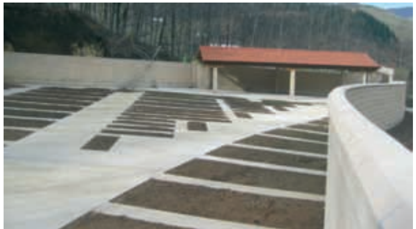
Itxura hau hartu du hilerri berriak.

Otsaileko haizete gorrek herriarentzat garrantzi berezia duen harrizko gurutzea hondatu zuen. Aizkoraren Museoa eraikiko den tokian zegoen gurutzea, Beintza eta Labaienen artean eta herritarrek tristuraz hartu zuten gertatutakoa. Halere, badirudi lehengo tokian ikusi ahal izanen dugula berriz ere. Principe de Viana Institutioak gurutzea bere gain hartu du eta konponduko duela esan du. Behin berrituta berriz bere tokian paratuko dute.