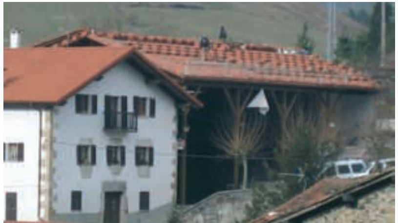
Frontoiari estalkia paratzeko lanak akituak daude dagoeneko.