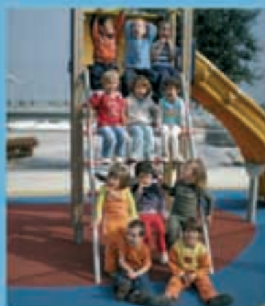
Lesaka: Irain E.P. Tel. 948 638 006

Gure herriko hizkuntza eta kultura bultzatuz Doan - Integratzailea Jantoki eta garrailo zerbitzuarekin Teknologi berriez baliatuta Haur eta Lehen Hezkuntza herri eskoletan DBH, Batxilergoak eta LH. bertako institutuan