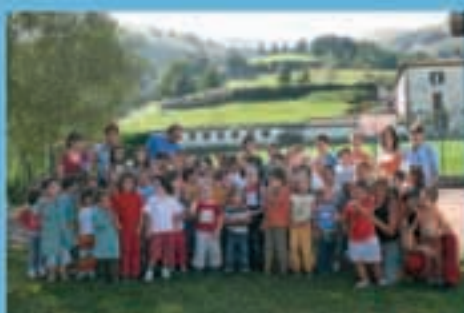
Etxalar: Landagain E.P. Tel. 948 635 215