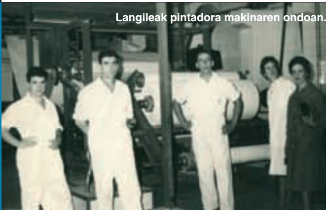
Langileak pintadora makinaren ondoan.