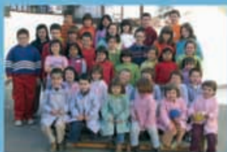
Arantza: Herri eskola Tel. 948 634 104