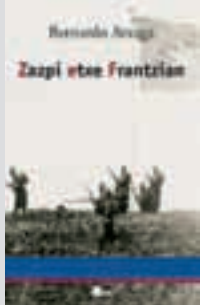
Zazpi etxe Frantzian