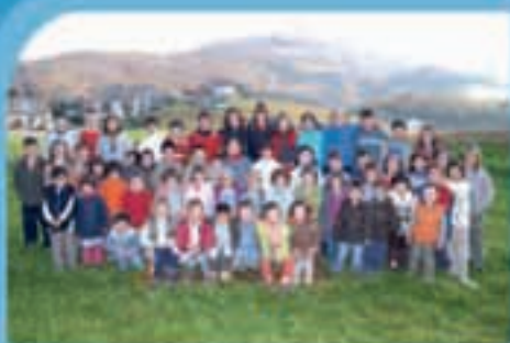
Igantzi: Herri eskola Tel. 948 637 829