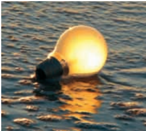
Urte hasieratik 250 kontsulta jaso ditu Irachek argindarra dela-eta.

2009an argindar enpresak hilabetero fakturatzen hasi dira, baina neurketa tres- netan bi hilabetetik egi- ten den irakurketa oi- narrizat hartuz. Gisa honetan, etxebizitza aunitzetan urtarrilean hartutako faktura ez da egiazko kontsumo- an oinarritzen, 2008ko urtarrilean