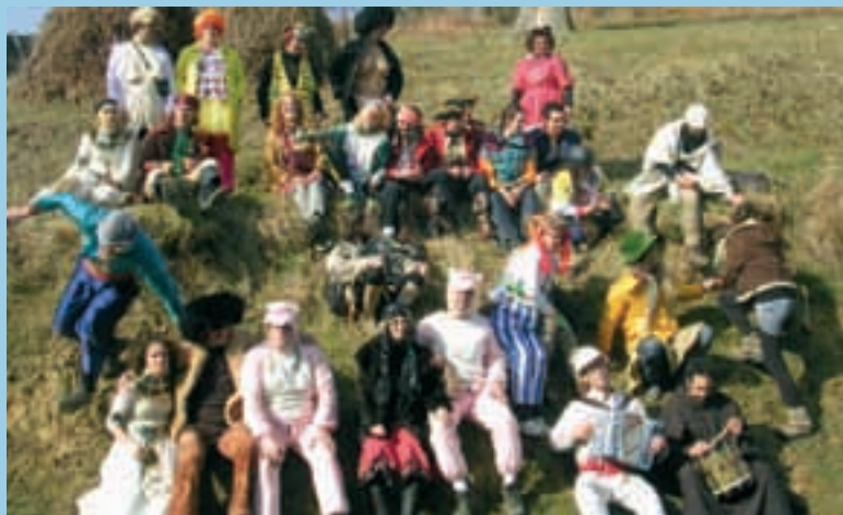
ARGAZIAK: KORO ETA MARGARI