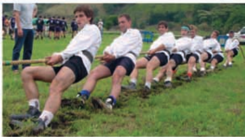
Aresoko taldea da Lur Gaineko Sokatira Txapelketan parte hartzen ari den eskualdeko talde bakarra.

Euskadiko Lur Gaineko Sokatira Txapelketako 600 kiloko bigarren jardunaldia Lesakan jokatu da uztailaren 5ean, larunbata. 680 kategoria bukatu ondotik, asteburu honetan hitzordu bikoitza izanen dute parte-hartzaileek. Larunbatean, hilak 28, 640 kiloko kategorian azken jardunaldia jokatu da Mutriku (Gipuzkoa). Horrez gain, igandean, ekainak 29, emanen zaio hasiera 600 kilokoari, Arratxun (Bizkaia). Lesakakoa bigarren saioa izanen da