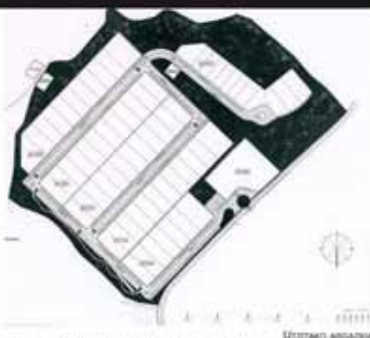
Arrakoitz Industrialdeko proiektua.