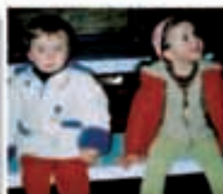
Gure bi alabakok dagoreniko 3 urte beteko dituzte uztailaren 10ean eta 15ean. Zorionak eta mami haundi! etxekoen partetik. Origi pasai!