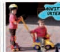
Auritz urtez Aizkozabalako eskularrak! Mami haundi bai Enekoena eta Enekoena Tiallekoen partetik. Merendola nozko? Emari amari prestatzeko.