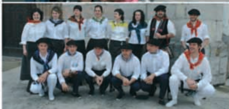
Bertizaranako Eguneako kroseko sarituak eta Dantza Luzean atera zirenak.