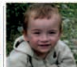
Zubietako Aritzek eskolarako mobilak prestatu omen du dagoreniko; 3 urte beteko baitu uztailaren 10ean. Zorionak gizonbato eta ez ahaztu gosaria sartzen. Mami potokoi. Aita eta ama.