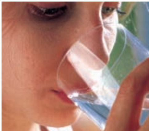
Egoera arruntean, zortzi ur-baso edan behar dela dioen mitoa ez da egia.

Sakelekoen gehiegizko erabilerak osasunean eragiten duela baieztatu dute, baina sakelekoeken erradiofrekuentzak minbizia eta bertzelako gaixotasunak sortzeko aukera areagotzen duen agiri sinesgarrikerik ere ez omen dago. Dena den, neurri tikiago batean, baina burmuinaren jardunean eta erreakzio-ondorran omen du eragina. Eta Berriki