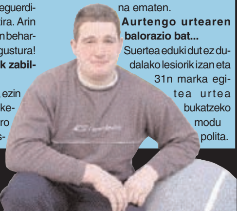
Inaxio PERURENA Leitzako harrijasotzailea

Suerte eduki dut ez dudalako lesiorik izan eta 31n marka egitea urtea bukatzeko modu polita.