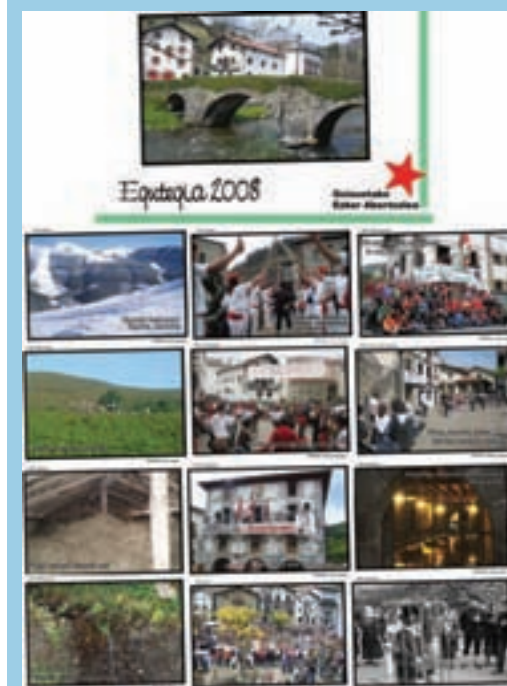
ARGAZKIA: UTZITAKO ARGAZKIA

Bere lehen emanaldiaren urtebetetzearekin kointzidituz, herriko koroaren saioa izanen da