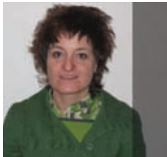
Goizuetako korua lanean hasi da