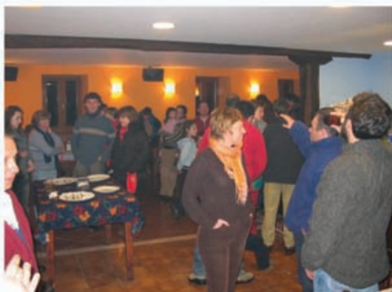
Aurtengoan ere giro ederra izngo da herriko festetan.