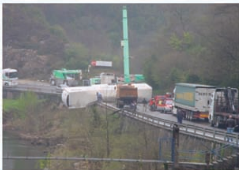
Istripua Villanuevako bihurtzunean, Bera eta Endarlatsa artean.

Istripuak pilatzen diren errepide zatiei dagokienez, horietatik bi eskualdean daude. Nola ez, Iruñetik Behobia-ra doan N-121A errepidean daude, Bera eta Endarlatsa artean (68,1-69,8 km) eta Sunbilla eta Igantzi artean (57,2-58,2 km). Bi zati hauek bihurtzune itxiak daude eta kontrako norabideko karrilera erraz jotzen dira ibilgailuak. 2007-2009 urteen artean egin beharreko hobekuntza lanekin arazoa moldatzea espero da. Bien bitartean, sei-