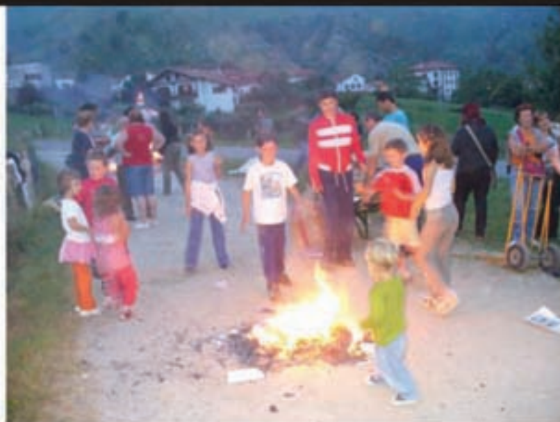
San Joan sua saltatzen gustora ibili ziren neska-mutikoak.

Iraila arte ez dute orai ateraldirik egingen.