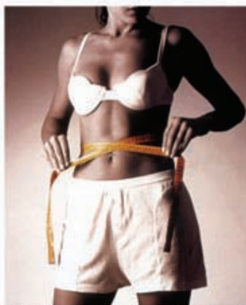
Ez fidatu egun guttitan pisua galduko duzula segurtatzen duten produktuekin.

Irache kontsumitzaile elkarteak, dieta egin nahi duten pertsonak aurretik mediku espezialista edo dietista batengana jozea aholkatzen du, egitan gehiegizko pisu arazorik badagoen eta dietan jartzea beharrezkoa den zehazteko. Profesional horrek, loditzeko arrazoiren bat ote dagoen kontraindikazio edo patologiarekin bat gertatzen ahal ote den aztertuko du. Ez fida-