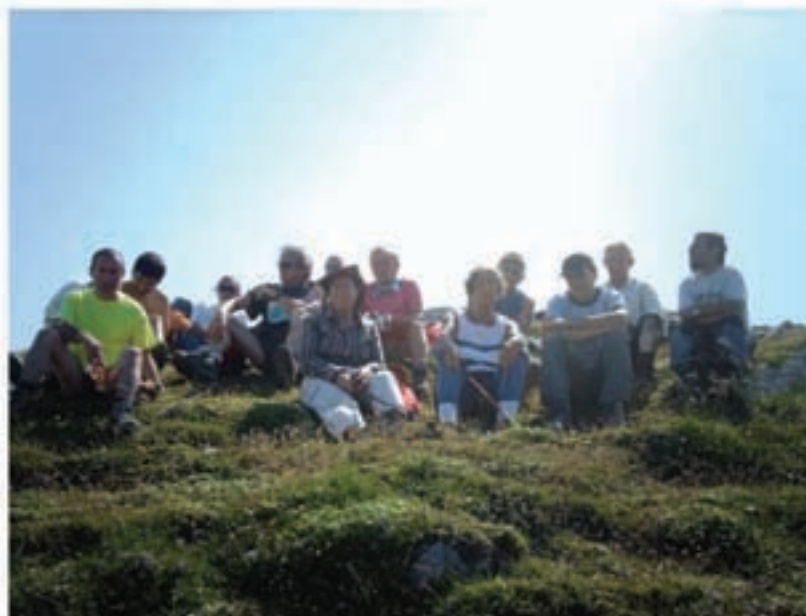
Atxuria taldeko hamalau mendizale igan zen uztailaren 2an Orhira. Iraillean Arrikulunkara ganen dira, baina bitartean ez dute bertze ateraldirik egingen.