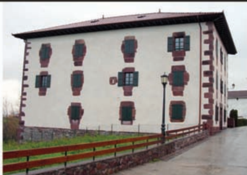
Sorginkeriaren Museoa heldu den urtean irekiko da eta gidari lanak egiteko formakuntza ikastaroa antolatu du Zugarramurdiko Udalak.

Ez antolatzea erabaki zenean, horren berri igorri zen hedabide-etara ahal bezain bat zabaltzeko, eta momentu honetan ere, eguna hurbiltzen ari denean, be-