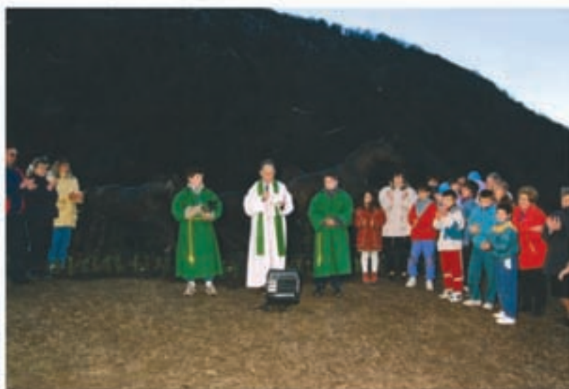
1997ko argazkia, Almandoz eta Belateko tunelak bedeinkatu zirenean. Hainbat herritar joan ziren ekitaldian parte hartzera eta, bidenabarkoan, herriari hain aldaketa handia ekarri zion lanak ikustera.

17:30ean: Haurren eta animatzen diren guztiendako txokolatada Leku-Ederren.