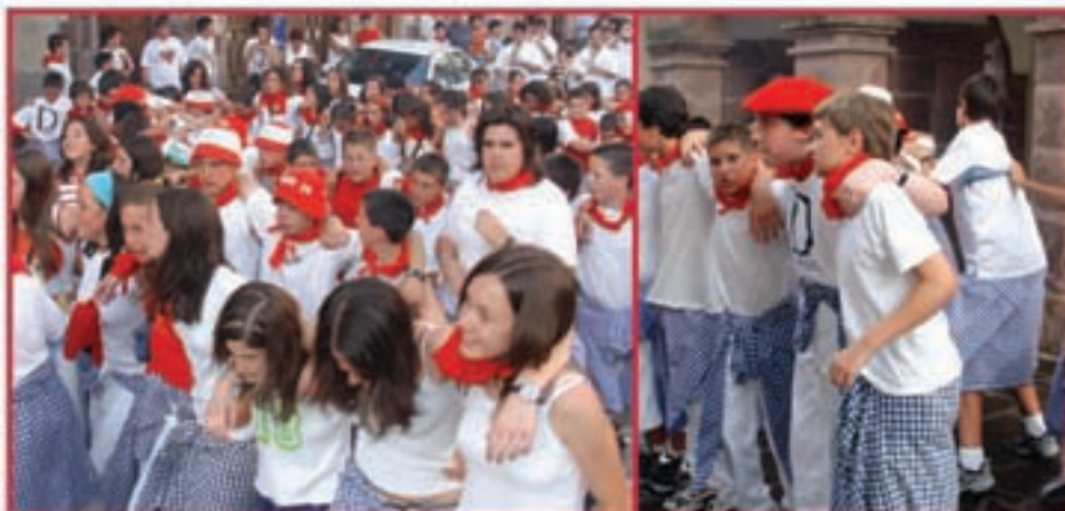
Txupinazoaren ondotik, besta eta dantza Doneztebeko Sanpedrotan

Parrokia, 21 DONEZTEBE Tel: 948 450 266 Faxa: 948 450 617 miriarin@yahoo.es