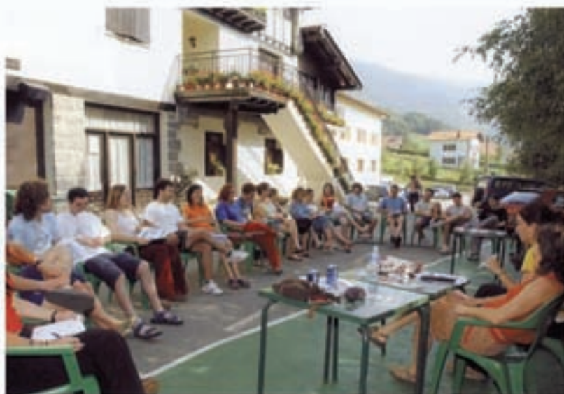
Euskara ikasi eta praktikatu ez ezik, herria girotzen dute eta herritarrek harremanak izaten dituzte Aterpeko barnetegian uztaila eta abuztuan izaten diren euskaldun berriek.

AEK-ko barnetegiak berriz, uztailaren 3tik hasi eta lau hamabortzaldietan talde ezberdinetan banatuko dira. Herriko eskolan klaseak izanen dituzte eta egonaldia berriz, otorduak eta lo egiteko zerbitzuak alegia, Aterpean emanen dituzte. Uztailaren 31a bitare beraz, herriari bi-