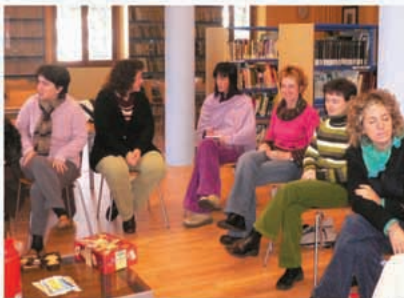
Guraso Eskolan emakumeak izan dira partehartzaile gehienak. Gizarte Gaietarako Batzordearen ustez, «hor bada non eragin eta non lan egin».

Guraso Eskola mar txan paratzeko indarra egin zen lehenbizi. Arrakasta neurrigabea izan da: bi talde osatu ziren lehenbiziko ikasturtean, 2004-2005ean, eta bertze bi osatu dira 2005-2006 ikasturte honetan. 30na guraso aritu dira ikasturte bakolitzean sei saioko bitxandatan. Aurtengo ikasturteko bigarren txanda ere orainxe hasiko da, eta matrikula zabalik dago. Bidari elkarteko Blas Campos pedagogoaren gidaritzapean joan dira bi ikasturte hauetako guraso eskolak.