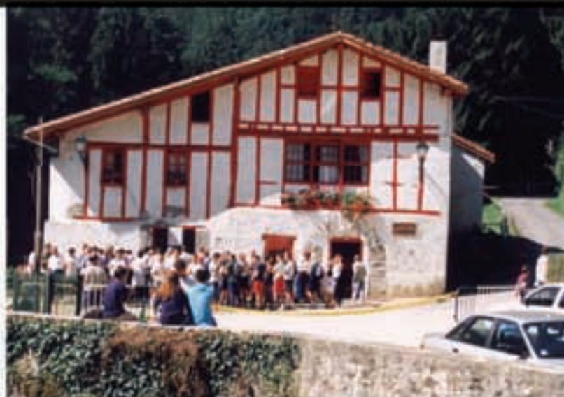
San Agustín eguna Artikutzan. Urtean behin, hainbat bisitari hartzen ditu Goizuetako auzoak. Bestela, autoan sartzeko baimena eskatu behar izaten da Donostiako Udaletxean.