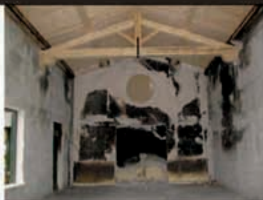
UTZIANO ARGAZKIA Gimnasioaren egoera ez da obra eta moldaketa egin den leku batena, argazkian ageri denez.

Guraso Elkartetik idatzi dutenez, «ikasleek ez dute lekunik egunerokoa lana egiteko, eskola tiki-ki delakoz eta gainera gimnasioa falta dutelako. Oraindik usain 'sust-magarrrien' arazoa ez da konpondu eta Osasun