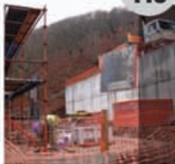
5.000 bizilagunen ur-hornidura 04

«Aizkolariak eta lasterkariak» izeneko bideoa egin du Agustin Aranburuk. 22 leitzarrekin bildu eta desagertzeaz dauden apostu eta desafio kontuak bildu ditu.