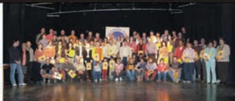
Joan den urtean 124 gizarte eragilek lortu zuten Bai Euskarari ziurtagiria.