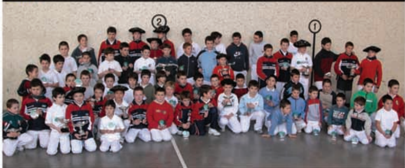
ARGADIAN, OSOR TXOPERENA

Txapelketan parte hartu duten pilotari gehienak ageri dira argazkian, sari banaketaren ondotik. Beheitiko argazkian, finalistak ageri dira, txapeldunak eta txapeldunordeak.