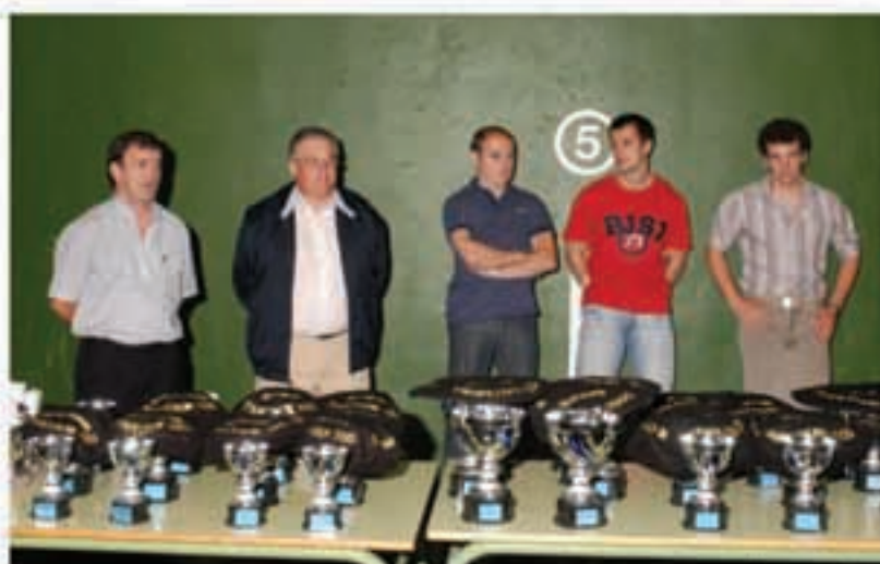
Hainbat sari eta zapel banatuko dira aurtengo Errekaren pilota txapelketan. Elite mailako txapelketa bereziki indartuko da.