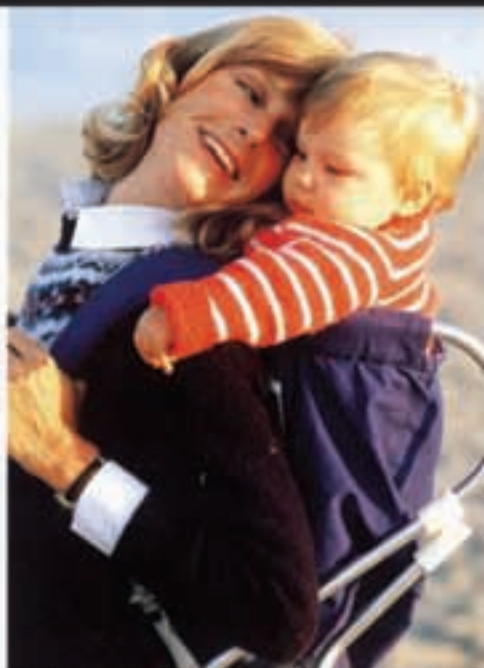
Haurrarekin une goxoak pasatzeko aukera polita da arratsaldeko eskurtsioa.

• Hartzatxoak urteak betetzen ditu: Bere