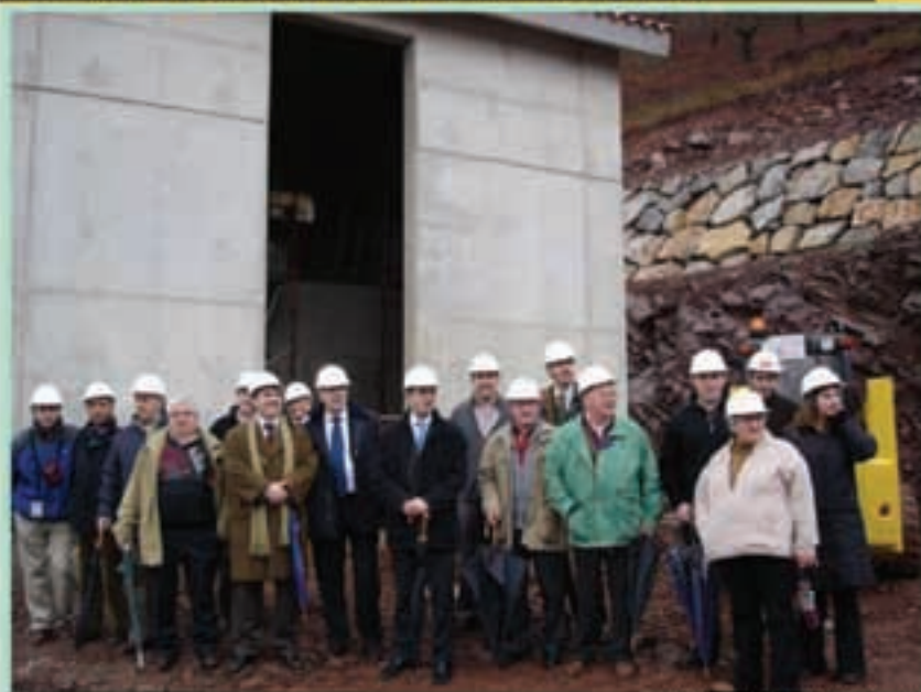
Urtarrilaren 18an lanak bisitatu zituzten Iruñeko eta udaletako ordezkariak.

Gezurra baldin badi-rudi ere, Euskal Herriko leku hezeenetako batean ur-hornidura arazoak izaten ziren orain arte. Baina gaur egungo ur-sarea eta depositoak zaharrak dira eta urteak dira Malerrekako herri hauek soluzioa eskatzen zutela. Iturengo alkateak jakinarazi digunez, «Ur arazorik handienak Donezteben eta gero Iturenen izaten ziren, Zubietan eta Elgorriagan arazorik ez zuten izaten. Gu nahiko juxtuan ibiltzen gara. Udan jende pila bat etortzen da, piztina pila bat badira, hus-