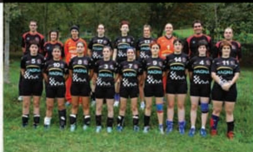
Lehendabiziko bi partidak galdu ondotik, Beti Onak taldearen kontrako derbia irabazi zuen Elizondon Magna-BKT eskubaloi taldeak.

Magna-BKT eskubaloi taldeak denboraldiko lehen garaipena eskuratu zuen urriaren 22an Elizondon. Partida berezia aukeratu zuen horretarako, Lehen Malla Nazionaleko nafar derbian nagusitu baitzen. 24-22 irabazi zioten baztandarrek Atarrabiako Beti Onak taldeari. Garaipenaren bidea topatuta, hortik segitzea da orai helburua.