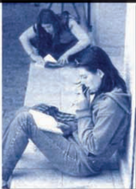
ARRAZOIA Ikasketak uzteko arrazoiak motibu zehatza baldin bada, horren inguruan lan egiten ahal da.

koa baldin bada, derrigorrezko ikasketak bukatzen dituen aldi berean lanean hastea proposatu. Behar bada, lanaren errealitatearekin harreman izatean gauzak modu errealistago batean ikusiko ditu. • Dagoeneko derrigorrezko ikasketak bukatu baldin baditu, lanbide modulu bat egitea proposatu, lan munduan sartu aitzinetik formakuntza ona izatearen garrantziaz