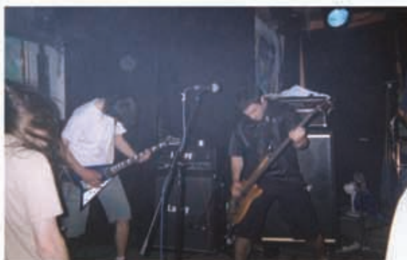
BKBO taldeak kontzertua eskainiko du, Trastiak eta Ingumarekin batera.

Gauean, urte guzi horietan gaztetxetik atera diren musika taldeak arituko dira. Trastiak taldeak, hasi eta hamahiru urte berantago, bere lehen kontzertua eskai-