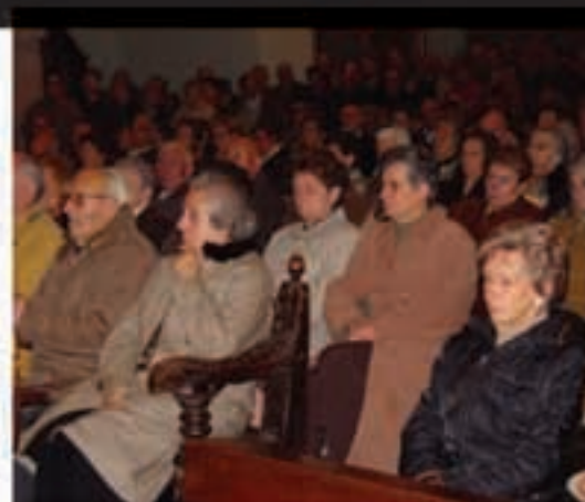
Hildako bazkideen aldeko meza izanen dute goizean Doneztebeko elizan.

harko ditu. Herrietatik irteera ordua, izena eman ondotik jakinaraziko da. 10:30etan meza izanen da Doneztebeko elizan eta hil diren bazkideen aldeko otoitza egingen da. Eguerdialdera berriz ere autobuaka hartu eta Gorraizera joanen dira bazkaltzera. Honako menua izanen dute Gazteluan: terrina