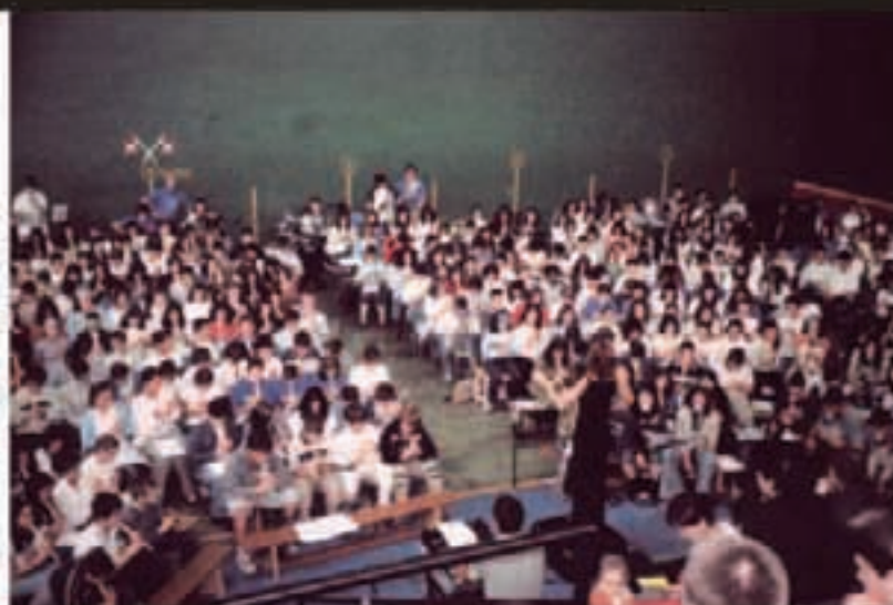
Leizako pilotalekuan maiatzaren 27an eskainiko dute emanaldia.

Lekaroz, Bera, Doneztebe, Leitza eta Altsasun izanen dira egunotan