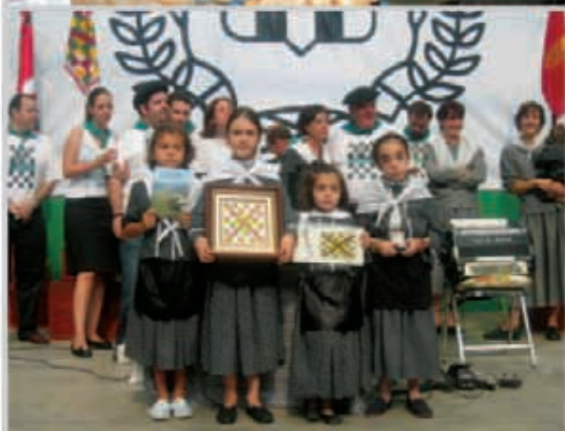
ARADIA: GIBEN ARRETZEN UTZA