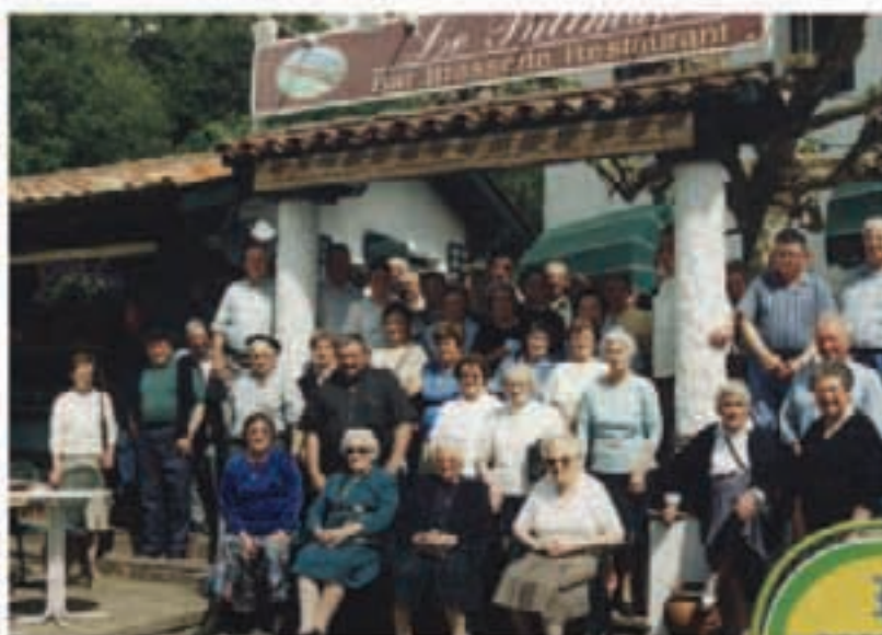
Beti Gazte adinekoen elkarteak bazkaria antolatu du maiatzaren 26rako. Aurretan ere hainbat saratar biltzea espero dute.

Ondotik kontzertua iragan zen polikiroldegian. 850 bat jonde ibili zen kontzertuan eta giro ona eman zuten etorriak ziren musikaririk.