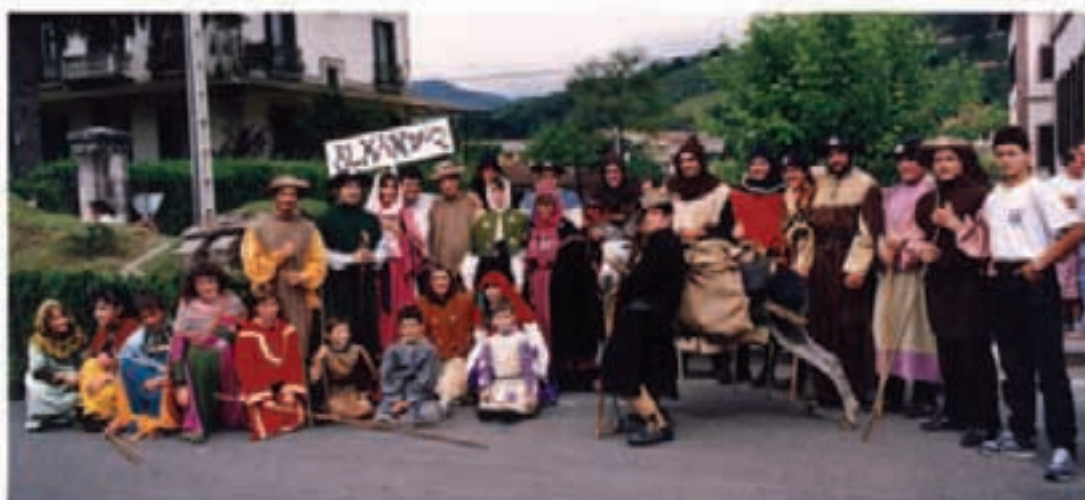
Argazkia: RAMON APEZTEKIAN / 1/204

8:00etan aurora herriko karraketan barna Bixentek lagundue goiza alaitzeko. 10:00etan auroran parte hartu dutenendako pasta eta moskatela. 12:00etan Meza nagusie herriko San Pedro elizan eta ondotik prozesioa. 13:00etan herriko plazan luntx berxie, txistu eta dantzari ez alaitue. 17:00etan emakume eta gizonen pala partiduek herriko plazan. 18:30etan herritarren arteko herri kirol jardunaldie. 22:00etan