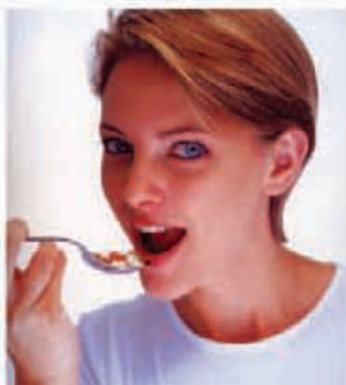
«Light» elikagaiak ez dute argaltzen. Kasurik onenean, guttiago loditzen dute.

Egun hauetan, udako oporrei begira, pertsona aunitzek erregimena egitea eta urtean irabazi dituzten soberako kiloak galtzea erabakitzen dute. Fabrikanteak horren jakitun dira, baita urte osoan milaka kontsumitzaileek praktikatzten duten «gorputzaren kuloaz» ere. Homegatik, merkaturuan sartu dituzte hainbat elikadura produkturen «light» eratorriak: margarinak, patata prexituak, freskagarriak, gozokiak... «Light» produktuak, mota bereko elikagai originalarekin konparatuz kilokaloria guttiago dituzten produktuak dira. Energia-murrizketa hori normalki, koipea edo azukrea, edo biak batera murriztean lortzen da, aditiboak edo zapora bera ematen duten