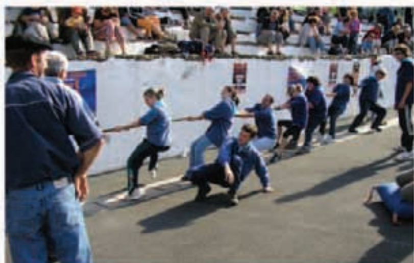
Zugarramurdiko taldeak Xiba Euskal Jokoen topaketan parte hartu zuen Saran. Sei mutil eta sei neska aritu ziren herri kirol ezberdinetan, tartean arpanan eta sokatiran.