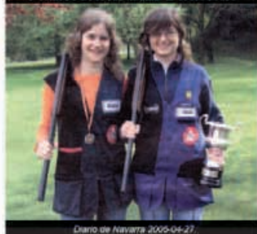
Diano de Navarra 2005-04-27.

«Izugami polita izanen litzateke nere ahizparekin batera Joku Olimpiko batzuetan konpetitzea, baina oraindik hagitz gazteak gara eta aitzinetik bide luzea egin behar dugu. Orain gogor entrenatu behar dugu». «Institutuan galdetzen didate nola gustatzen zaidan ehizira joatea eta mundian, ehiztari aunitz hamituak gelditzen dira begira. Ehizira joateko eskubidea izanen dugu badal».