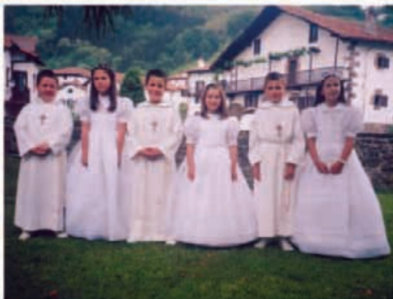
Joan den urtean neska-mutikok egin zuten lehen jaunartzea. Aurten bi berterrik ez dira izanen.

Heldu den ekainaren 5ean egingen da aurtengo Gasna Feria Eguna. Urtero bezala, bazkaria izanen da eguerdiko 2etan eta harat joateko txartelak. Herriko Ostatuan, Elutsan edo Albatako bazkideren bateri eskatuta eros daitezke. 18 euro balioko dute helduentzako txartelak eta 15 haurrentzakoak. Heldu den maiatzaren 30ean akabatuko da epea.