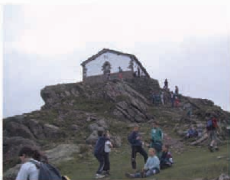
Urtero bezala hainbat bisitari, erromes eta mendizale hurbilduko dira Trinitate egunean Mendauroko kaxkora.

Iturengo udalak Aurtizko karriketan ur-hornidura eta saneamendu