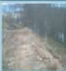
Lurra uesten lekuan harrira agertu da.