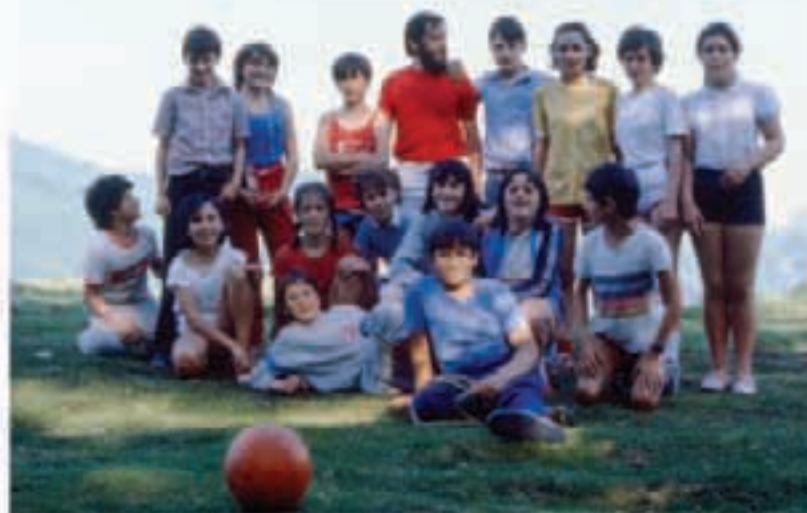
Irain Eskolaren 25. urteurrena ospatzeko modua izanen da irain eskolaren 25. urteurrena ospatzeko eginen den argazki erakusketan.

ikasle eta ikasle ohiei zuzendua. Txartelak maiatzaren 15a arte eskuratzen ahal dira Telebole ostaluan. Arratsaldez ere izanen dira ekitaldi gehiago, hauek ere eskolan edo konbentuan, eguraldiaren arabera. Mus txapelketa, 17:30etan haurrentzako ipuin kontalaria eta merendua izanen dira,