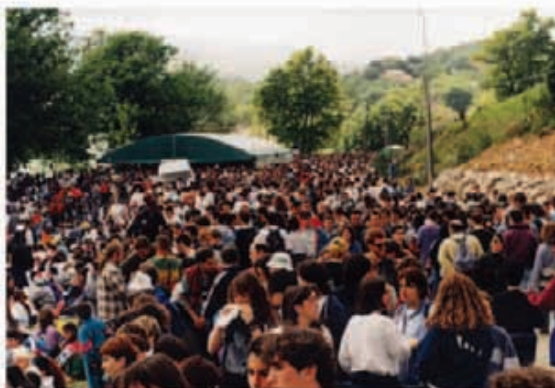
Urtero bezala, milaka jende bildu zen aitzira inguruan Herri Urrats karrietara, Iparraldeko ikastolak sustengatzeko. Besta haundiaren irabazlekin bigarren hezkuntzako bi ikastegi berri irekiko dira.