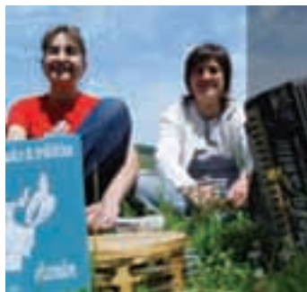
Trikitixa Eguna Elizondon igandean