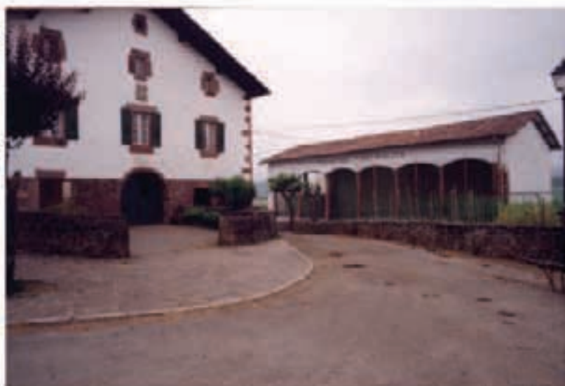
Lekarozko Txiki-Polita pilotalekuan teilatua moldatu eta bertze berrikuntza lanak egiteko 86.236,92 euroko aurrekontua izanen da eta dirulaguntza eskatu du Udalak.

Nafarroako Gobernuko Gizarte Ongizate, Kirol eta Gaztediaren kontseilariak kirol instalazioetan inbertsioak egiteko atera duen dirulaguntza deialdiaren barnean, zenbait eskari egin ditu Balleko Udalak. Gehien bat, frontoietan teilatua moldatu eta bertze lanak egiteko eskatu ditu Baztango Udalak dirulaguntzak. Honela, Elbeteko Ameztialde frontoia, 34.731,93 euroko aurrekontuarekin; Erratzuko Etxelebert frontoia, 111.704,33 euroko aurrekontuarekin; Garzaingo frontoia, 44.325,16 euroko aurrekontuarekin; Lekarozko Txiki-Polita frontoia, 86.236,92 euroko aurrekontuarekin eta