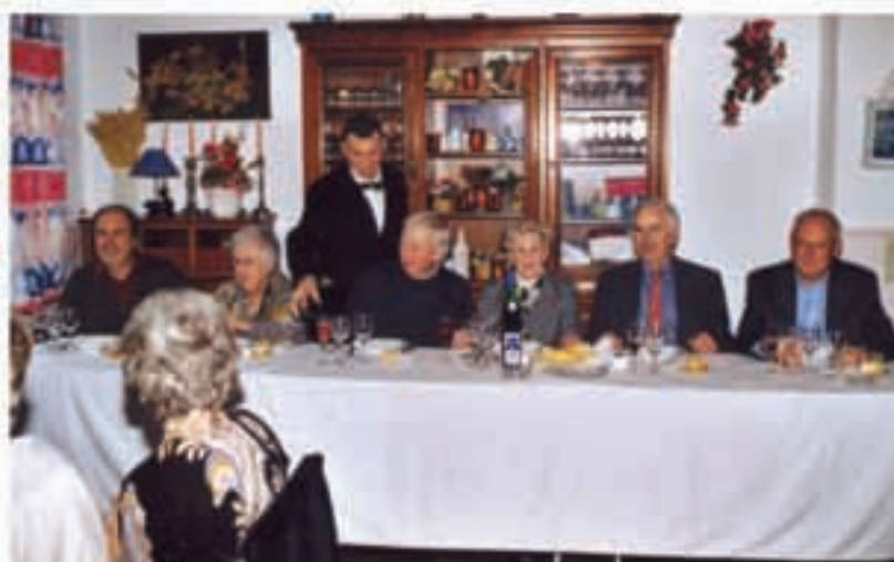
Adin ederra lehenagoko gazteak biltzen dituen elkarteak bazkaria izan zuen gan den urtarrilaren 20an Ibarungo Fronton ostatuan.

Mozorrotzeko eguna otsailaren 19an larunbatarekin egingen da aurtentzen. Herriko elkarte ainitzek prestatzen dituzte urtero ihauteriak. Zi-