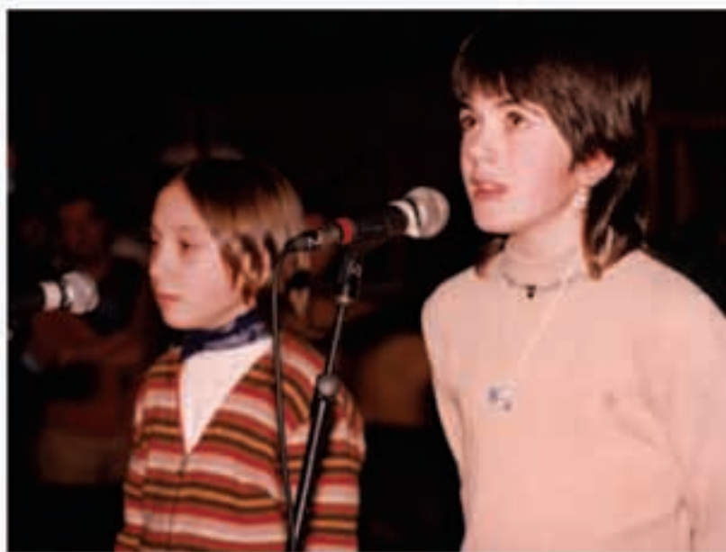
Binaka, banaka nahiz taldeka eman daiteke izena haur kantu txapelketan.

Otsailaren 19an abiatuko da Tafallako frontoian Nafarroako Euskal Kantuzaleen Elkarteak, Nafarroako Gobernuaren Hezkuntza Departamentuaren babesarekin antolatzen duen haur kantari txapelketaren edizio berri bat. Gainerako kanporaketak Burlata, Altsasu eta Donezteben egingen dira eta finala Iruñeko Gaiarre Antzokian izanen da. Euskal Kantuzaleen elkarteak antolatzen du haur kantari txapelketa. Euskal Kantuzaleen Elkarteak Nafarroan euskaraz abesteko dagoen ohitura aberatsa mantentzen eta bultzatzen duen erakundea da. Honen eredu den Nafarroako Haur kantari Txapelketa haurrei espreski bideratutakoa, duela hamar urtetik goiti ospatzen da Nafarroan. Irakasleendako, kanta haurrak motibatuzko eta hezituzko tresna da, eskoletako ikasleak anima daite-