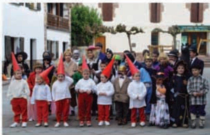
Ortzegun Gizen egunean antzeztan eskolako neska-umtikoek herriko eta Arantzako ikusleen aitzinean.

Joan den ortzegunean, otsailaren 3an herriko ttikienek eman zieten hasiera ifautiei. Eguraldi ederra izan zuten goizean etxeko zingar eta arraultze eskean ibiltzeko. Arratsaldeko partean, 14:45ak aldera eskolako haur guztiak plazan bildu ziren arratsaldeko ikuskizunari hasiera emateko. Aurten ez ziren herriko haurrak bildu ziren ba-