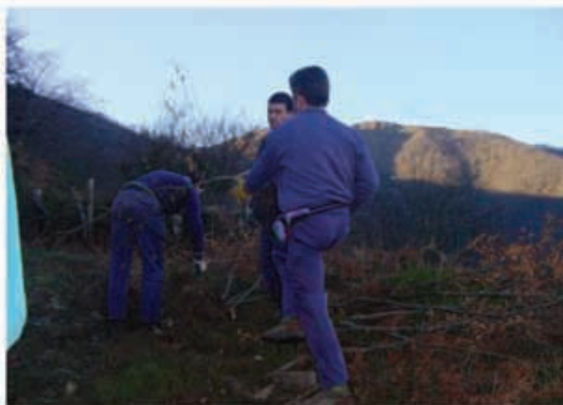
Aurten ere udal langileen laguntza izan dute eskolako ikasle eta irakasleek zuhaitzak landatzeko.