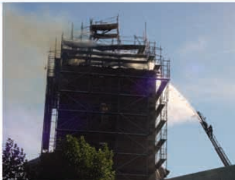
2003. urteko irailaren 16an, herriko besten ondotik erre zen elizako ezkil dorrea. Orain, urte hasieran elizaren konponketan hasi dira eta 859.872 euroko aurrekontua duten lanak egingen dira.

Urtarrilaren 15etik goiti eta otsailaren 19 arte Saran jende kondaketa egingen da. Hori egiten da Frantziako jendetzaren ezagutzeko. Kondaketa honek xehetasun zenbatuak emanen ditu jendetzari buruz eta bizilekuek. Herriko Etxeak eta Estatistika eta ekonomia ikerketarako erankunde nazionalak (Insee) lan hori elkarrekin egiten dute. Kondaketa egileak auzapezak hautatuak ditu, Saran lau pertsona dira orotara. Kondaketa egilea etxetan pasatuko da, egoitza hosto eta banazko agiri bategin, etxean bizi diren pertsona bakoitzarentzat utziko ditu. Galde zerrenda guztiak bete beharko dira osoki eta garbiki. Pertsona bera berriz etorriko da paperak berreskuratzeko, eta denbora berdinean laguntzen ahal du ere galderei ihardesten nahi dutenentzat.