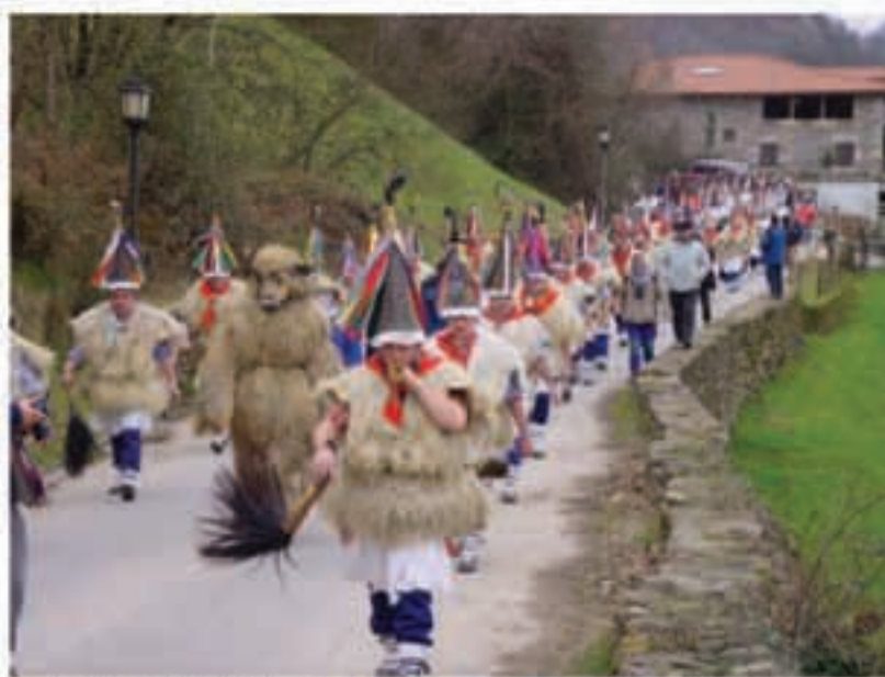
Joaldunak eta mozorroak protagonista.

Asteartean, berriz, Zubietan izan zen egun handia. Oraingoan, Ituren eta Aurtitzko joaldunek jo zuten Zubietan aldera eta Zubietako joaldunak errotara atera ziren ongi-etorria eskaintzera. Ordurako mozorro besta ederra bazen Zubietako plazan, baina joaldunak agertu zirenean hauek hartu zuten protagonismoa. Aurtengoan, Zubietan,