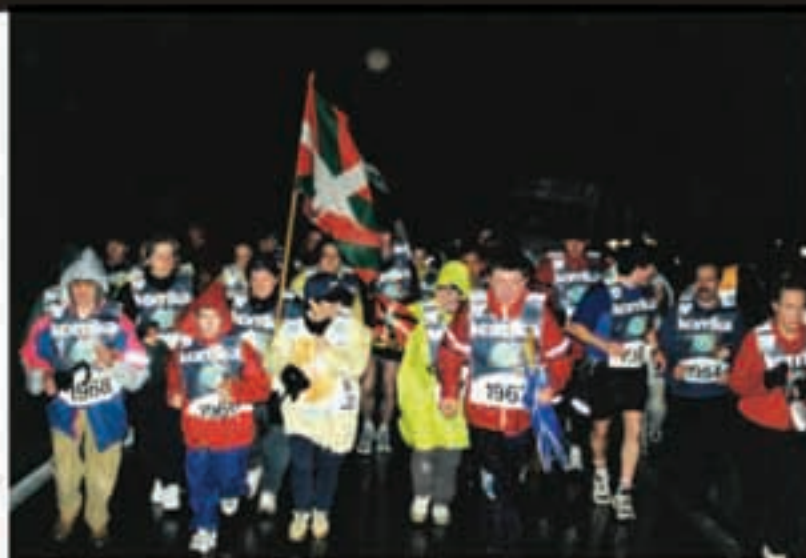
2001ean Korrika herritik pasatu zenean 700 metroko kilometroak egin behar izan zituen antolakuntzak, eskari ikaragarriari erantzun ahal izateko.

Heritik Goiko Gainera bitarteko 15 kilometroak saltzea da goi-