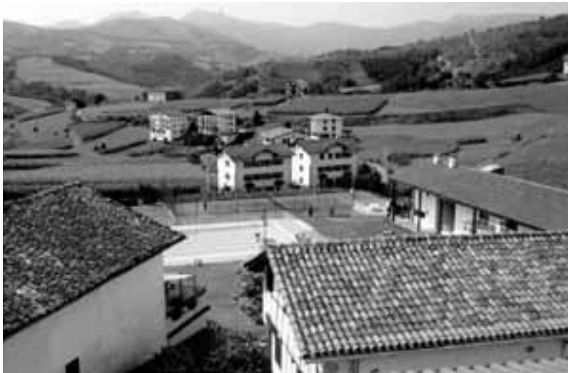
Igerilekua aurten hartzeko lehiaketa zabaldu da.

Sarreraren salneurriak ere aldatu egin dira: Denboraldiko abonua 4.500 pta. gostako zaie helduei, 11 urtetatik 18tara 3.000, 4tik 10tara 2.000 eta ttikiagoak dohainik. Eguneko sarrerak, berriz, honela