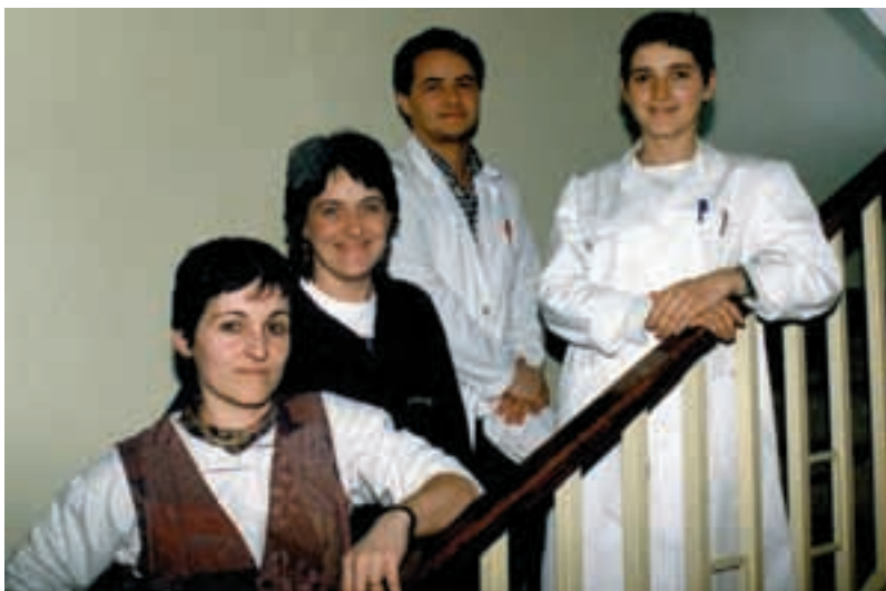
Elizondoko Cofeseko langileek parte hartuko dute menopausiari buruzko saioetan.

Osasun Etxetik adie- razitakoaren arabera, menopausia zer den, al- daketak eta eragiten dio- ten faktoreak; norbera-