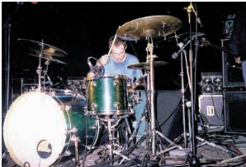
Dut taldeak gan den urtean eman kontzertuaren irudi bat.

rakoa atxikitzea erabakia izan da eta hauek dira maiatzaren 5ean arikuko diren taldeak: Sarako trikitixak, Zizkuitz txaranga, Unama, Empalot, The 3peace, Anestesia eta Eztanda.