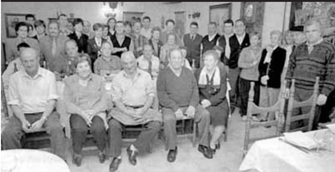
Baztan, Urdazubi eta Zugarramurdiko odol-emaileak, bazkal ondoan.