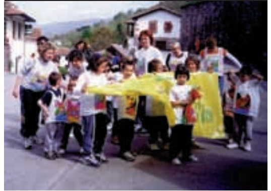
Korrika Txikia Zugarramurdin barna.