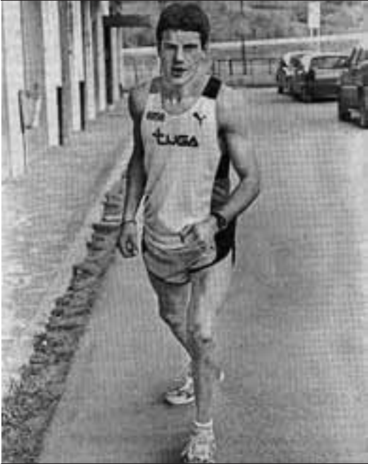
Diario de Noticias 01eko apirilak 3

«Badakit atletismoan profesional izatea arras zaila dela, baina eginahal guziak eginen ditut. Oraindik arras urrun ikusten dut, juniorretan lehen urtea dudalako eta senior mailara ailegatu bitartean bide luzea delako. Edozein gise, kirola ikasketekin uztartuko dut».