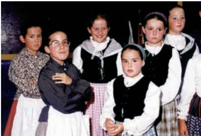
Dantza taldeak karriz karriz ibiliko dira goizean. GARBINE SARASOLAK UTZIA

Apirilaren 29an, igandearekin, Tantirumairu dantza taldeak antolatutako Tantirudantza eguna ospatuko da. Aitzineko urteetako dantzari tiki egunen gisako egitaraua izanen da Tantirudantza jaialdian ere. 11etan hameketakoa eskainiko zaie parte hartuko duten dantza taldeei. Aurten, Faltzesko Makaia, Lasarteko Erketz, Santutxuko Gaztedi eta Sarako Zazpiak Bat taldeekin ariko da Tantirumairu dantza taldea. Hameketakoaren ondotik, taldeak karriz karriz ibiliko dira, beraien dantza emanaldiak ibilaldi ezberdinen barna eskainiz. Ordubata aldera, Zubigai-