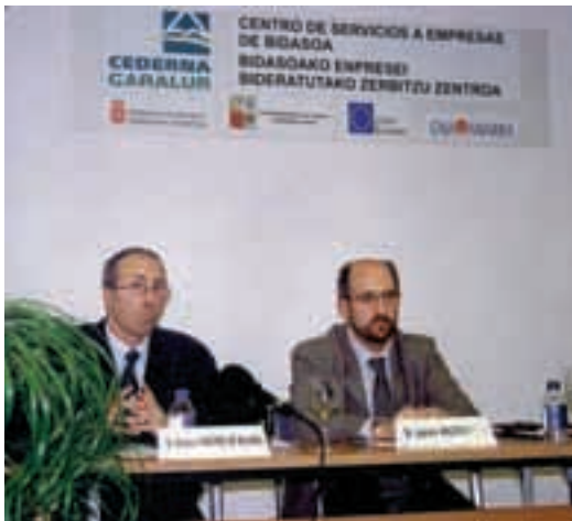
Aurkezpen ekitaldiko irudia.

Lesakako alkateak adierazi zuenez, «gazteei irtenbidea eman nahi zaie mindegi honenkin. Gazteei beraiek beraien lanbidea sortzeko aukera eman nahi zaie eta horretarako lokalak lortzea izaten da arazorik handiena. Lehen bi urtetarako leku hori eskainiko zaie enpresa mindegian, zenbait zerbitzu osaga-