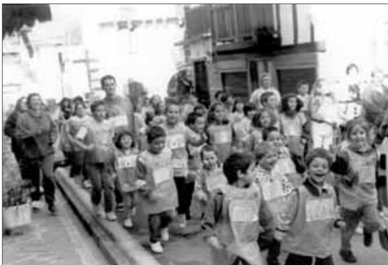
Beraien dortsala prestatu ondotik, Landagain eskolako neska-mutikok Korrika Ttikian hartuko dute parte ortziral arratsaldean.

Landagain eskolako ikasleek egun bat lehenago ospatuko dute Korrika. Bertze urte batez, haur guziek hartuko dute parte euskararen alde. Aitzinetik, haur bakoitzak bere dortsala prestatuko du, dago-kion zenbakiarekin. 4:30etan denak bilduko