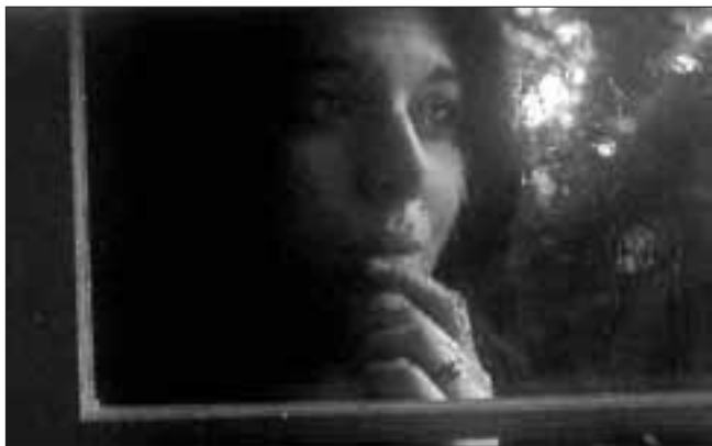
Emakumea isolatzea izaten da tratu txar psikologikoren ondorioa.

Iraintzeari, segika ibiltzeari, umiliatzeari, etxetik kanpo lan egitea edo lagunak izatea ukatzeari, mehatxatzeari,