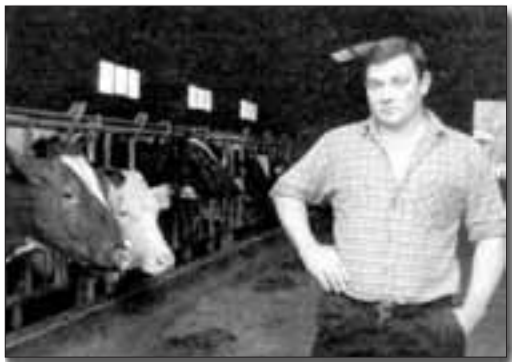
Diario Vasco 01eko martxoak 23

«Ez dut etorkizuna batere argia ikusten, aziendak baitziren nire negozioa eta orain dena hondatu da. Balle guzian pentsu bera ematen genuen, beraz, Baztanen behi ero gehiago agertuko direla iduritzen zait».