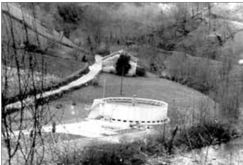
Saneamenduko obrak bukatzen direnean errendimendu osoa aterako zaio depuradorari.

Menditatiek materiala ateratzeko herri bideen erabilera arautzen duen ordenantzen aplikazioan sakoneko alda-