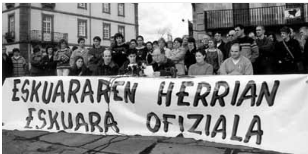
Eskuararen ofizialtasuna aldarrikatuz agerpen publikoa egin dute herriko hainbat elkarte.