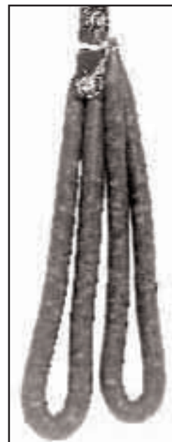
PAGOLA TXISTORRAREN IZENA