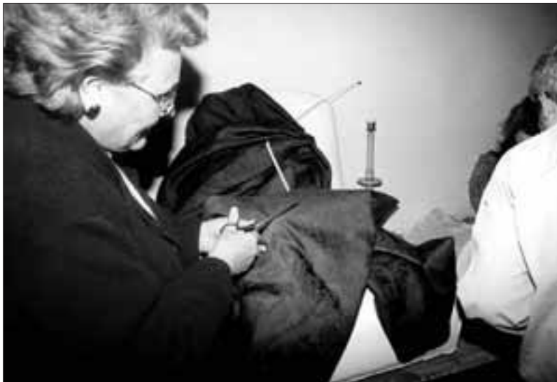
Ezpelura emakume taldeak bere ikastaroekin segitzen du. Jostungintzaren ondotik, areto-dantzekin hasi dira orain.

Malerrekako Ezpelura Emakume Elkarteak Azkoitia eta Donostiara bidaia antolatu du igande honetan, apirilak 8. Goizean Azkoitiako Trenbidearen Museo bisitatuko dute eta trenean ibilaldia egingen dute. Bazkaria norbere kabuz egingen dute Donostian. Arratsaldean Donostiako Akuariuma bisitatuko dute. Bidaia nahi duten guzientzako zabalik izanen da eta Ezpeluratik bereziki animatu nahi dituzte Baztan eta Bortzirietako bizilagunak, bidai honetan parte hartzeko. Ezpelurako bazkideek 3.500 pezeta ordaindu beharko dituzte eta bazkide ez direnek 4.000 pezeta (sarrerak barne). Nafarroako Kutxako Club 10 txartela dutenek 500 pezeta guttiago ordaindu beharko dituzte. Doneztebeko Nafarroako Kutxan eman behar da izena. Bertzal-