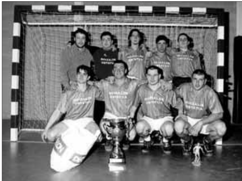
Goizalde Ostatuak, IX. futbito txapelketako irabazleak.

Aitzinetik, hirugarren eta laugarren posturako norgehiagoka jokatu zen eta hemen Lesakako Haizegoa Ostatuak aisa gailendu zitzaion Elizondoko Txokoto Ostatuari, 6-0. Bi partida hauek jokatu on-