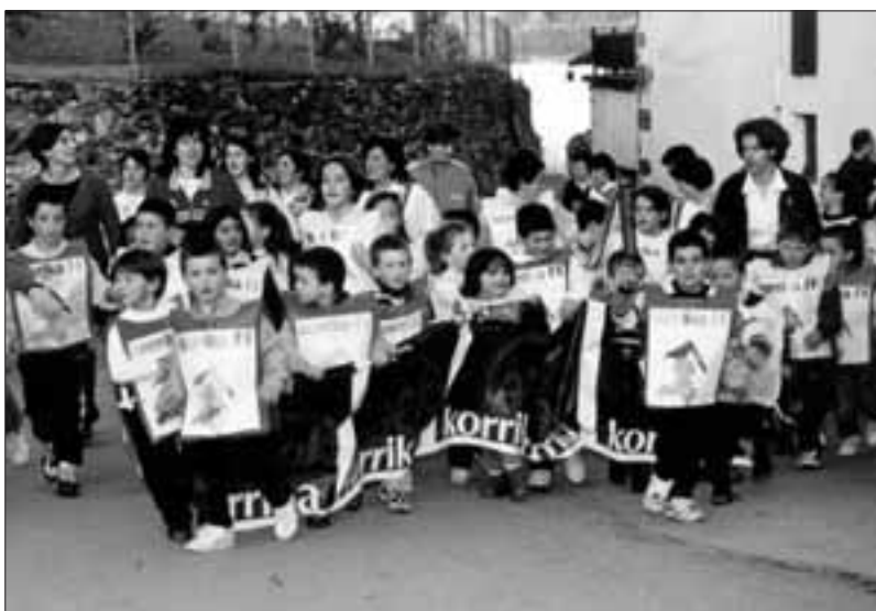
Larunbat arratsaldean izanen da haurren txanda Korrika 12an. Argazkian Haur Hezkuntzan zeuden neska-mutikoak ikusten ahal dira, orain dela bi urteko herriko itzulixka egiten.

Bertze bi urte joan zaizkigu ustekabeen eta hemen dugu berriz ere Korrika, 12.a hain zuzen ere. Igande goizaldean du bere hitzordua Igantzitik pasatzeko, 5ak aldera. Beraz, aurtengoan lasterka ibili nahi duenak goiz mugitu beharko du, edo gaua berandu arte luzatu, denetik izanen baita seguraski. Aitzinekoan bezala, hiru kilometro egitea egokitu zaigu igantziarroi, hiru baitira erosi direnak ere: Herrikoetxekoa, Biltoki eta Eskolak Guraso Elkartearekin erdi bana egindakoa. Ondotik, gosaria egin behar omen dute ibiltzen diren guziek Biltokin, baina hori bertze nonbait ere jakinaraziko dute segurrago. Korrikaren besta, ordea, larunbatean