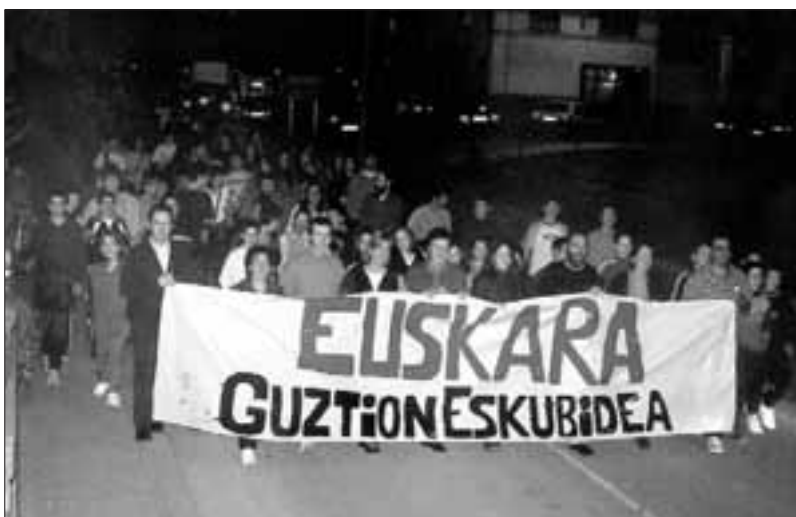
Martxoaren 23an «Euskara guztion eskubidea» lemapean egin zen manifestazioan bostehun bat leitzar eta aresoar bildu ziren.

Mahai-ingurua giro baikor eta alai batean joan dadin, hasiera eta