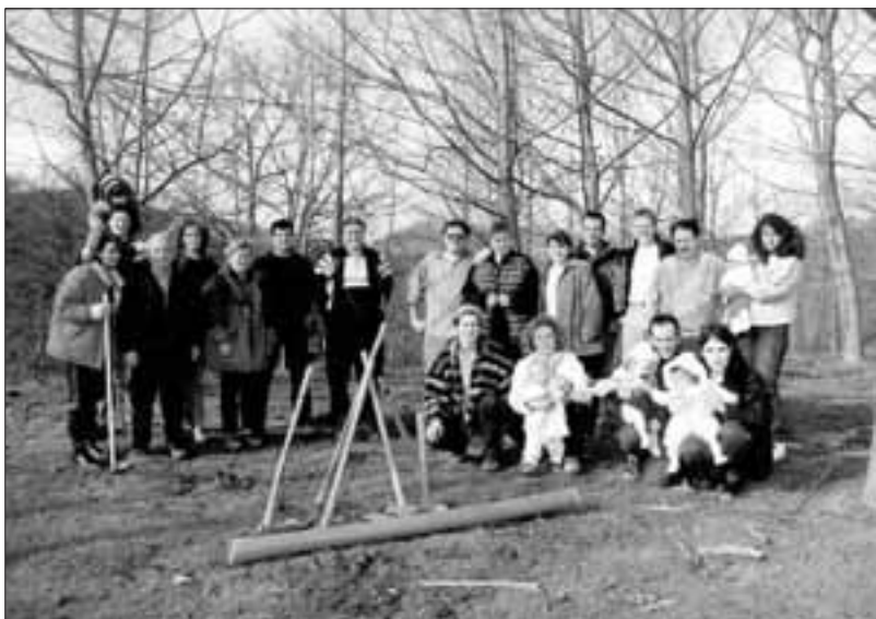
Bordaxuritan landatutako haritzek joan den urtean herrian sortutako neska-mutikoen izenak izanen dituzte.