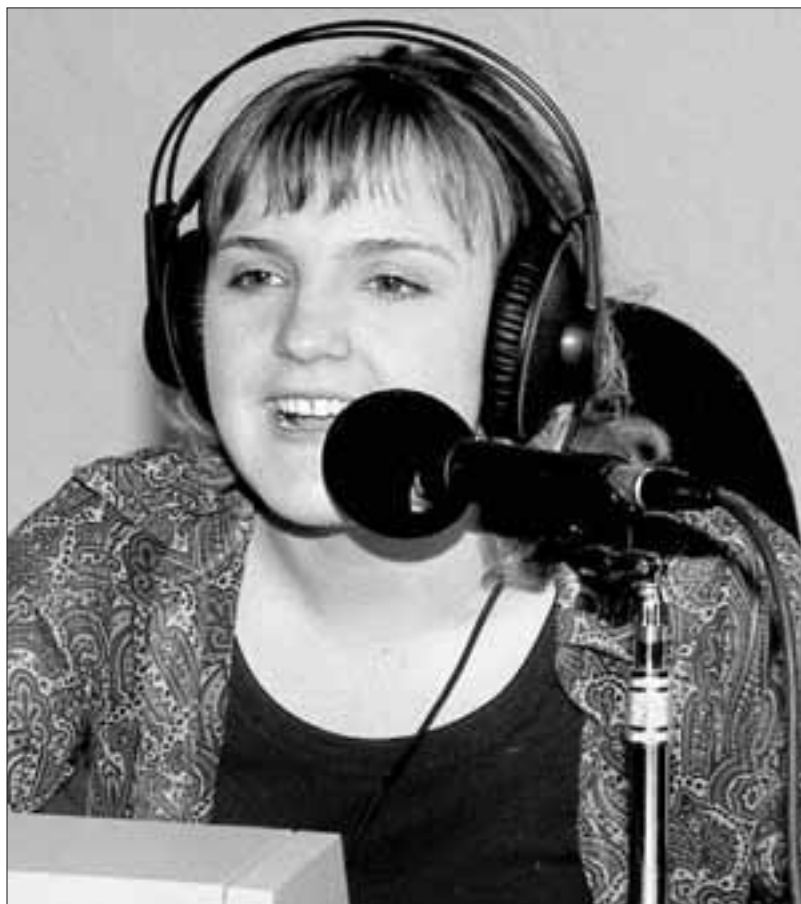
«Irratia aberastu egingen da eta gehiago nabarituko da eskualde osokoa dela».

Duela lauzpabortz urte hasi zen Xorroxin aditzen Bortzirietan eta somatzen dugu entzulego bat ere badela. Lehiaketetan parte hartzen duen jendeak hori erakusten du. Bidean dauden garraiolariak eta etxeko andre batzuk entzuten digute, ikusterakoan erraten didatela-koz, "egunero aditzen zaitut". Lantoki ba-