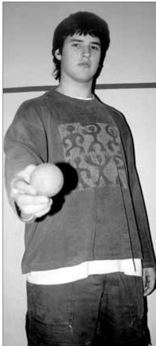
«Atzelari jotzaileak dira min gehien egiten didatenak, denei bezala».

► “Nire aurrelariak dakien hura egitea gustatzen zait. Errematatzailea bada, pilota duenean errematatzea eta pilotari abiadura ematen badio, lasai sartu eta jotzea.”