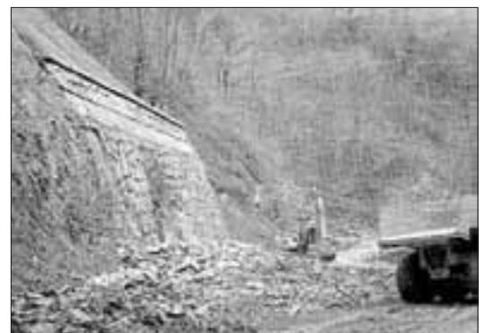
Lur-eroriak saihesteko hiru paretak egin dira Zubieta eta Saldias bidegurutzearen artean.

kitzeko asmoa zuten baino segurtasun arrazoiengatik ilbeltzera atzeratu zuten. Baina euriek lur-eroriak eragin zituzten eta orain arte itxia mantendu da Saldias eta Zubieta arteko zati hori. Herrilan Departamendutik adie-