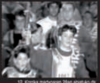
12. Korrika martxoaren 28an abiatuko da

Martxoaren 28an abiatuko da Gasteiztik 12. Korrika. Bi urtetik bi urtera ospatzen den euskararen aldeko lasterketa hau apirilaren 8an sartuko da gure eskualdean, bainan gure telebistan lehen egunetik emanen dugu lasterketaren berri. Horrez gain, Korrika Kulturaren barneko ekitaldiek (ikus agenda) ere bere xokoa izanen dute telebistan.