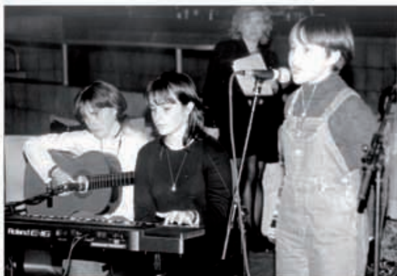
Eskualdeko kantari gaztetxoak ariko dira larunbatean Bordatxon.

Larunbat honetan, martxoak 24, arratsaldeko 6etatik aitzinera burutuko da Doneztebeko Bordatxo dantza-lekuan Nafarroako Haur Kantari txapelketako kanporaketa. Doneztebeko saioan, batez ere inguru honetako kantariak ariko dira. Lesaka, Bera, Irurita, Doneztebe, Larrainzar, Goizuetta, Arano eta Beteluko hogeitau talde, bikote eta bakarlarik ariko dira kantuan, guztira 120 haur eta gaztetxo inguru. Lodosan martxoaren 10ean eta Irurtzumen 17an (Leitza eta Aresoko kantariak bertan parte hartu zuten) saioen ondotik burutuko da Doneztebeko. Ondotik, martxoaren 31n bertze saioa egingen da Ariben. Puntuazioaren arabera, hogeitau talde, bikote eta