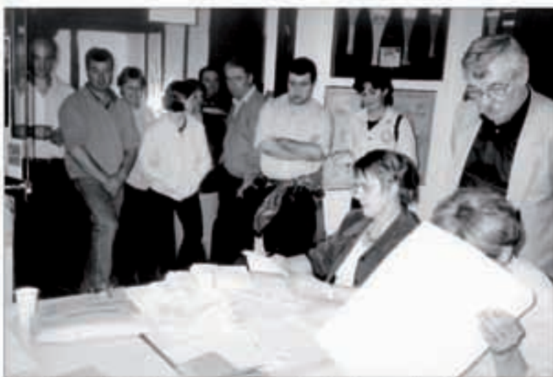
Herritarren %77,4ak eman zuen boza herriko kontseilariak hautatzeko.