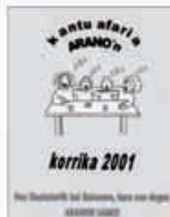
Kantu afariaren kartela.

Martxoaren 1ean egindako osoko bilkuran zozketatu ziren loteak. Eskale bakoitzari bere alderdian ematea kontutan hartu zen, ahal den gertuen izan deza-