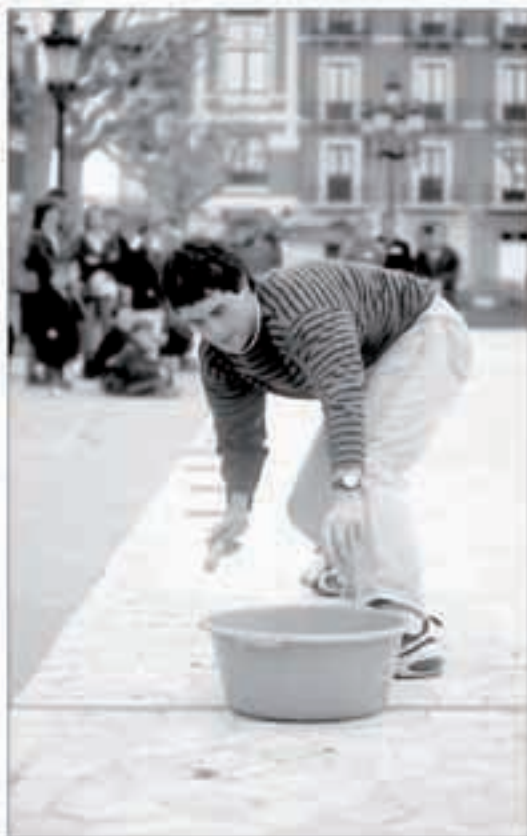
Joan den urtean Bermeon elkartu ziren Leitza, Sara eta Bermeoko euskaltzaleak, hainbat ekitaldi eginez. Asteburu honetan Leitza bilduko dira.

Aipatutakoaz gain, bada aparte esan beharreko beste ekitaldi bat ere. Larunbatean, arratsaldeko hiruetan hasi eta bederatziak bitarte Iñaki Perurena 100 kiloko harria 1.300 aldiz altxatzen saiatuko da.