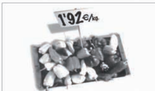
Euroaren laburdura EUR izanen da hizkuntza guzietan.

ezin izanen da IRPF delakoa eurotan egin. Hala ere, deklarazio negatiboengatik itzuli beharreko kopuruak eurotan