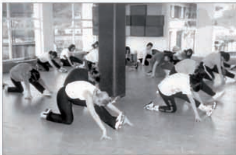
Musikaren erritmora mugitzen du gorputza argazkiko neska taldeak.