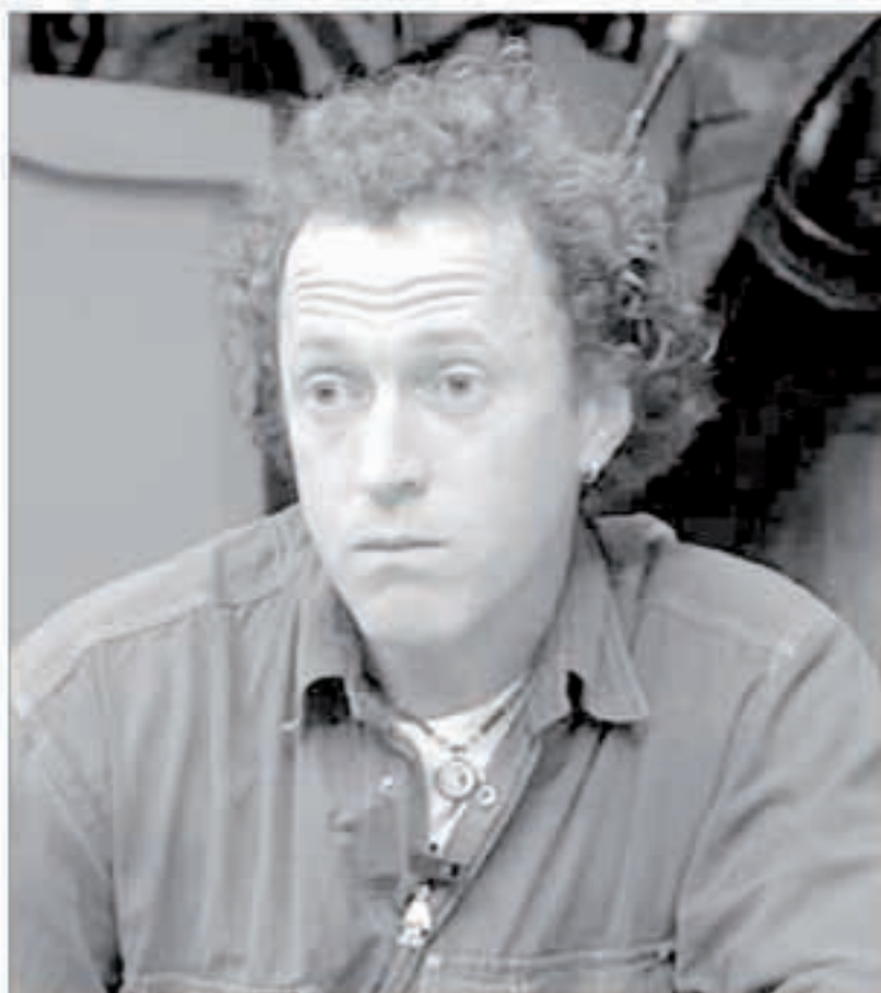
«Etorkizuneko Europan hizkuntzak aberastasun kulturalak direla ikusi behar da».

► Bortziriak, Baztan edo Malerrekako gazteek ez dute ohitura handirik hemelako ekitaldietan parte hartzeko. Aukera ederra dute orain.