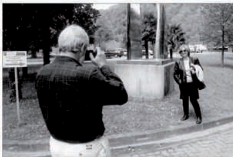
Bertiz bisitatzen dutenek margolan onenak bozkatuko dituzte.

tentzeko ideiarekin sortu den lehenbiziko lehiaketa hau Espainiako edo bertan bizi diren artistei zuzendua dago. Lan guziek inoiz argitaratu edo saritu gabekoak izan behar dute. Lanak maiatzaren 4ko arratsaldeko 6ak baino lehen aurkeztu beharko dira Bertizko natur parkeko palazioan. Palazioko ordutegia goizeko 10etatik 1etara eta arratsaldeko 4etatik 6etara da, eta informazio gehiagorako 948 592387 telefonora dei-