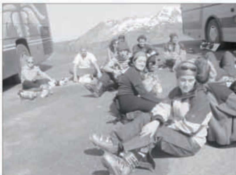
Luz Ardidenera egindako ateraldian ederki ibili ziren gazteak.

Urtero bezala, aurten ere Nafarroako Kirol Jolasen barnean antolatutako herri kirol txapelketan parte hartzen ari dira herriko neska-mutikoak. Martxoaren 11n Lakuntzan jokatu zen lehendabiziko saioa eta herrikoek haur eta kadete mailako proba konbinatuan hartu zuten parte. Haur mailakoak laugarren izan ziren, bortz talderen artean (Arantzakoekin batera, Lakuntza, Altsasu eta Etxarri Aranazko Muxarrak eta Arranoak taldeak ari dira). Kadete mailakoak hobekiago aritu ziren lehen saio horretan, zazpi talderen artean bigarrenak izan baitziren (Arantzakoekin batera Berriozar, Ultzama, Lakuntza, Altsasu, Txantreako Eunate eta Etxarri