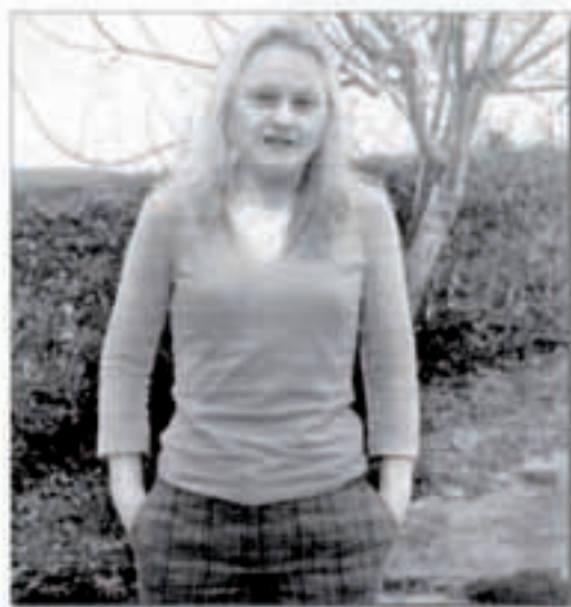
Diario de Noticias 01eko martxoak 15

«Kubako Lagunen saria irabazteak asko harritu nau, margolana orain dela lau urte aurkeztu bainuen. Duela aste batzuk sariaren berri jaso nuenen, ez nintzen koadroaz oroitzen ere».