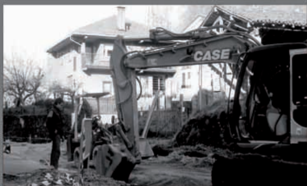
Ur garbi eta zikinaren sareak berritu eta, ondotik, zolaberritzea dira Nafarroako Gobernuak onartutako lan aunitz.