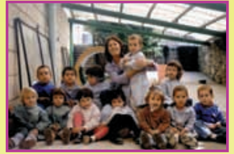
BERA: Ricardo Baroja E.P. ☎ 948 625 019