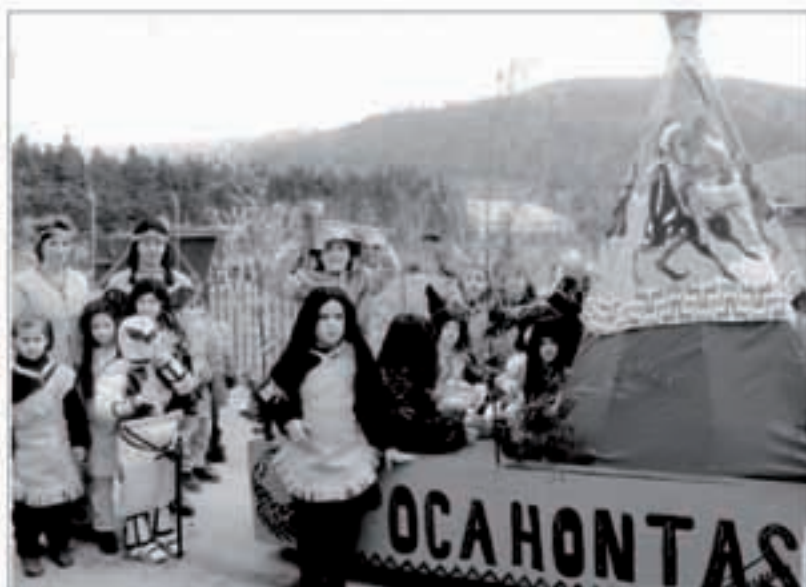
Aurten ere, hainbat mozorro eta karroza ikustea espero da.

Arratsaldean ere baserrietan ibiliko dira. Arratsalde eta gaueko musika Beti Alai txarangak jarriko du, baita Amezitia jatetxean eginen den afarian ere. Mozorro onenari bi go-