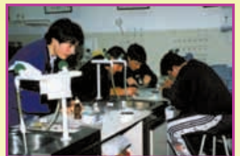
TOKI-ONA Institutua ☎ 948 625 000