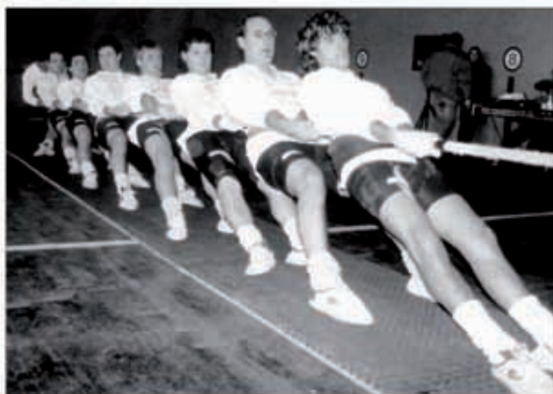
Aresoko taldeak gogor ekin dio Euskal Herriko txapelketari.

Otsailaren 10ean hasi zen Leioan (Bizkaia) Euskal Herriko goma gaineko sokatira txapelketa. 560 kiloko lehen saioan, gizonetzoketan, Areso izan zen onena, tiraldi guztiak irabaziz. Nafarroako txapelketan Beti Gazteren menpe egon ziren, baina Euskal Herrikoa lortzen ahal dutela erakutsi zuten. Bigarren Beti Gazte izan zen. Lesakarrak Aresorekin galdu zuten, baina gainerako tiraldiak irabazi egin zituzten, nahiz eta Leioako Euskal Kirol Zaleakekin lan dextente egin behar izan zuten. Hirugarren Abadiño izan zen, laugarrena Euskal Kirol Zaleak eta bosgarren Altamira-Gazteak. Azken postuan berdinduak gelditu zi-