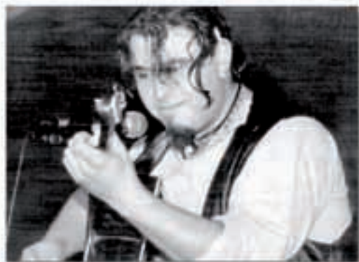
GARA 01eko orrialde 09

«Hiru egunetan egin dugu grabazioa, hagitx abuda beraz. Bi egun behar izan ditugu gitarrak eta ahotsak sartu ahal izateko. Bertze egun batean, berriz, diskoko adorno guztiak sartu ahal izan ditugu, teklatuak eta biolinak batik bat. Azken batean, etxean bezala egin dugu diskoa».