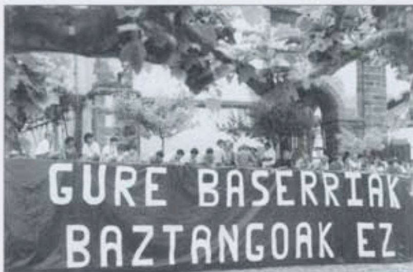
Baserriarrek zugarramurdiarrak sentitzen direla azpimarratu dute, baina Baztanek ez dio bere lurraldearen zati bati uko egin nahi.

Elizondoko ANFAS, gunititu fisiko eta siki-