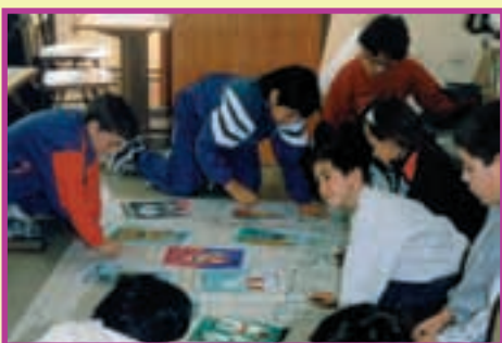
LESAKA: Irain E.P. ☎ 948 638 006