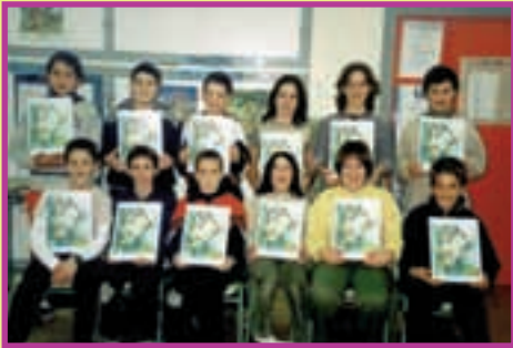
ARANTZA: Herri Eskola ☎ 948 634 104