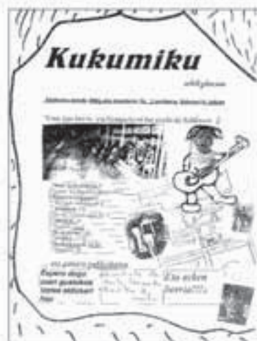
Hogeitortzi aldizkaria atera dute Saldiasko eskolako ikasleek.

ra. Berrien tartean erraten dute, « gaur egun zazpi ikasle ditu Saldiasko eskolak eta hurrengo urtean bost geratuko dira. baliteke, hemendiko bi urtera Saldiasko eskola itzea ».