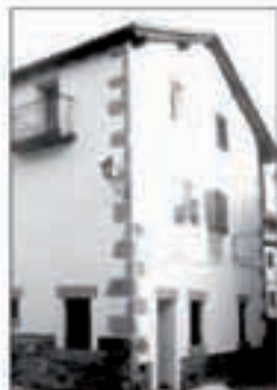
Herriko Etxeko ostatua urtebeterako emanen du Udalak.

Proposamenak Elgorriagako udal bulegoetan aurkezteko epea martxoaren 5ean goizeko 11etan akituko da. Eskaintzak martxoaren 12an, arratseko 8etan zabalduko dira leku berrietan.