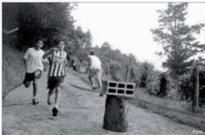
Orain arte krosa bertze atletismo kirolik ez zuten egiten ahal Berako gazteek.

Aspacek egoitza ireki nahi du Beran Etxe funtzionala deitzen