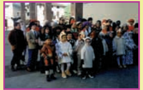
ETXALAR: Landagain E.P. ☎ 948 635 215