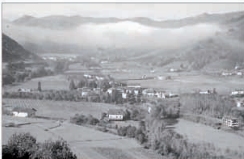
Gaur egungo errepedearen eta abudo eginen denaren artean kokatuko litzateke lantegi berria, NARBARTEN. Artxibokoa

Oieregiko kontzejuak ez du nahi aluminio lantegi bat Bertizko jaurreriaren ondoan eta kirolera zuzendua dagoen lur eremuan jartzetik. Bertizaranako Udalak ortziral honetan egin behar zuen gaia aztertzeke batzarra, baina Oieregiko kontzejuak aitzinetik erakutsi du kontrako jarrera. Udalarari eta Nafarroako Gobernuari bidalitako akordioan Oieregiko kontzejuko kideek diotenez, « industria ekarriko duen edozein proiekturen alde gaude, baina ingurumena zaindu behar da eta Bertizko jaurreriarendako ez dardila kaltegarria izan ».