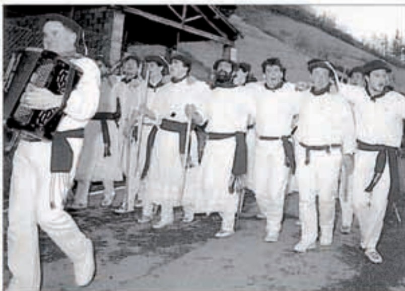
Mozorroak puska biltzen ibiliko dira aurtien ere.

Prestatutako egitaraua zuzen betetzen baldin bada, astelehenean goizeko 8etarako Zibolatik goiti izanen dira mozorroak. «Kamino partikularrean» bi talde egingen dira eta berehala hasiko da baserriz baserriko puska biltzea. Herrian ere izanen da zer ikusi arratsaldeko