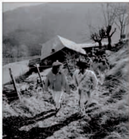
Zomorroak, Suroan hasi eta auzoz auzo ibili ziren igandean.

kartean bazkaldu zuten eta gero zagi dantza egiteko elkartetik herri sarrerara joan ziren, saltoka makilak eskuan ziztuztela. Lau lekutan dantzatzatzen da zagi dantza, Tximitxeneko atean, Etxe-Haundiko atean, Itturri parean eta azken saioa plaza. Ihauteriak bukatzeko, herri afaria egin zen.