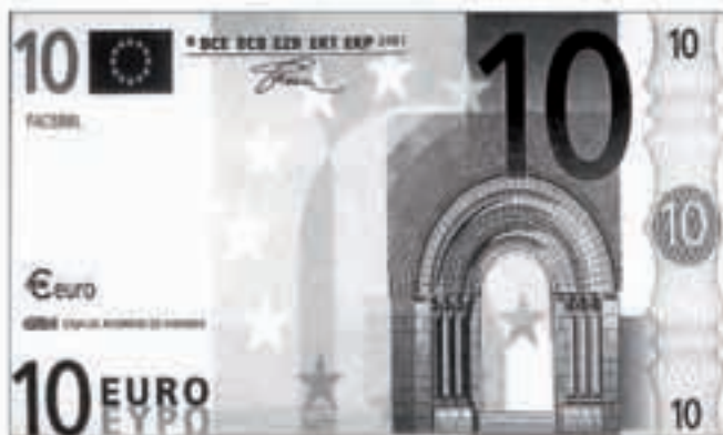
2002ko otsailaren 28a euroak soilik izanen du balioa.

Euroaren sarrerak ez du eraginik izanen lehenagotik hartuak ditugun maileguen balioan.