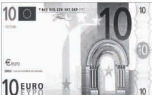
2002ko urtarrilaren 1ean izanen da Euroa moneta bakarra.

Komenigarria da transferentzia guztiak fakturak agertzen duen monetan egitea, edo