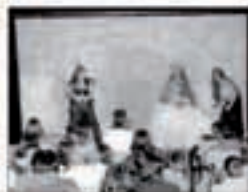
Joan den urteko Kultur Egunetako irudiak.

izanen da haurrentzat. Gaia: Paperaren birziklapena.