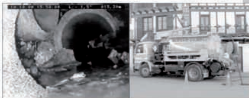
Gisa honetako irudiak jasotzen ditu kamioleko kamarak.

Bada Altzate ez ezik, herri guziko hodiak aztertzeko kontratatu Udalak, hau da, lur-azpiko bide hauek gainbegiratzeko. Lehenik robot itxurako gurgildun kamerak erabiltzen ditu enpresa honek tubotan barrera sartu eta egon litezkeen matxurak edo itxausurak aur-