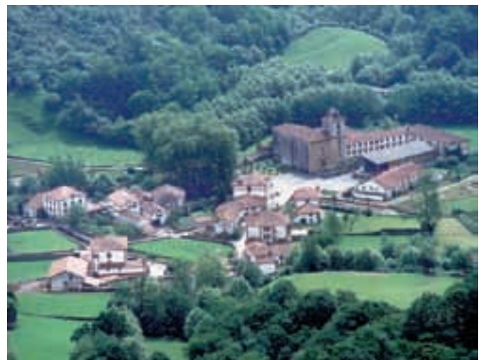
Dantxarineako merkataritza zentruaren indartzeak bizi berria eman dio uda honetan Urdazubiko turismo eta komertzioari.

Peiok aipatu digu « Urdazubiko Udalak merkataritza indartzeko duen interesa ». Gisa honetan, eta aktibidade berrien laguntzarekin, Dantxarinea indarberritu da turismo eta industriaren ikuspegitik. Gainera, herri hauetan aktibidade berriak abian jar-