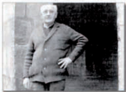
Diario de Noticias 00ko azaroak 17

«Eguneroko elkarbizitzak gorabeherak sortzen ditu gure herrietan, hori belarunaldiz belarunaldi errepikatzen da. Guri gertatzen zaiguna okerrera dela pentsatzen dugu, baina leku guzietan arazoak daude eta denak berdintsuak dira».