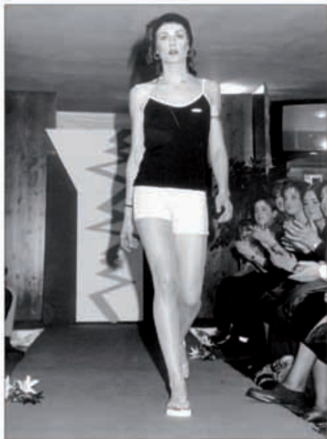
Adin eta estilo guzietako jendearendako arropa eta osagarriak plazaratzen dira desfileetan.

xamar izaten ahal da, baina Eguberrietako eskaintza ikusteko garaia aproposa da. Gainera, aurten besta eguna baldin bada ere, San Frantzisko egunean hemendik Gipuzkoara erosketak egitera joateko joera dago eta horrek mina egiten die hemengo komertzioei».