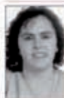
Korbil EZEIZA Kontsumitzailea. Areso:

Kontsumitzaile be-zala kezka sortzen dit behi eroen eritasunak, nola ez.