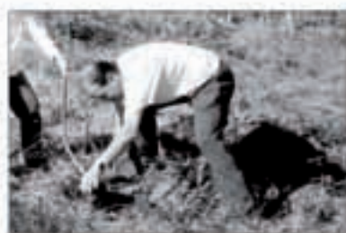
Gehienbat pinuak landatuko dira Zumaleku inguruan. Artibokoa

Guzira 24.739 zuhaitz sartuko dira: 11.277 larizio pinu, 5.955 haritz, 2.893 haritz zuri, 818 lizar, 818 platanu, 720 ezki, 720 urki eta 720 mendiko zumar. Orain haritz, gaztain, pago eta urki zuhaitz bakan batzuk eta sasua bertzerik ez dago inguru horretan.