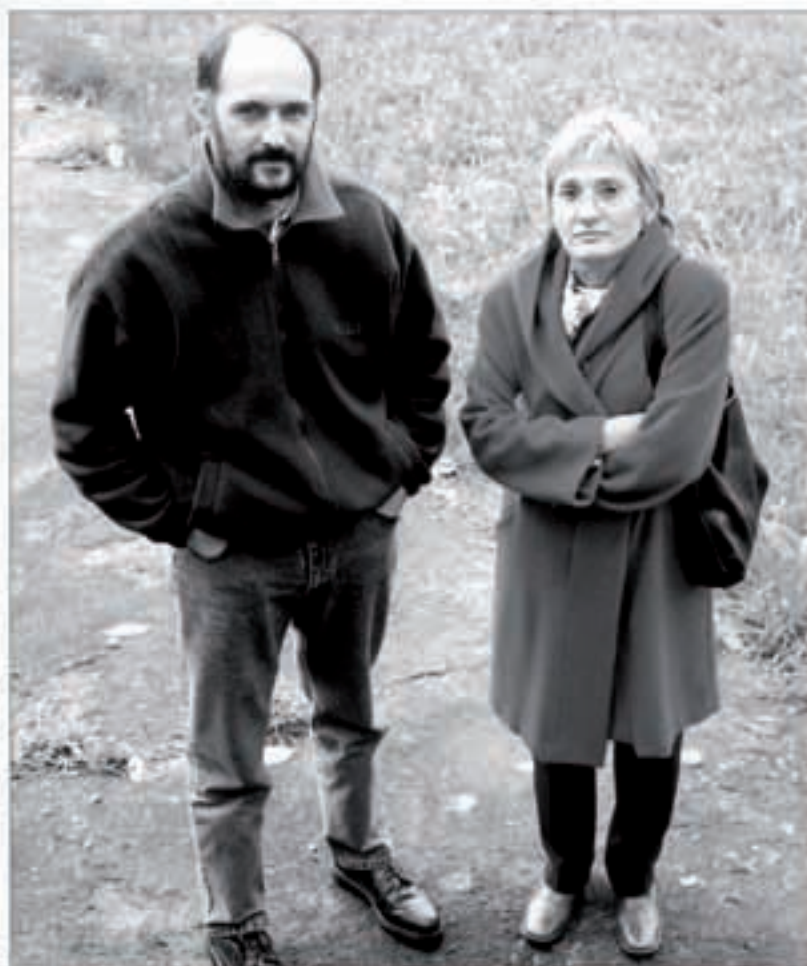
«Boluntario izateko, laguntzeko gogoia izan behar da bakarrik».

Bertalde, urte honetan lau traslado egin ditugu. Guk ez dugu edozein traslado, behar gorrian daudenak bakarrik. Izan ere, lehenbizi gizarteak ematen dituen laguntzak daude,