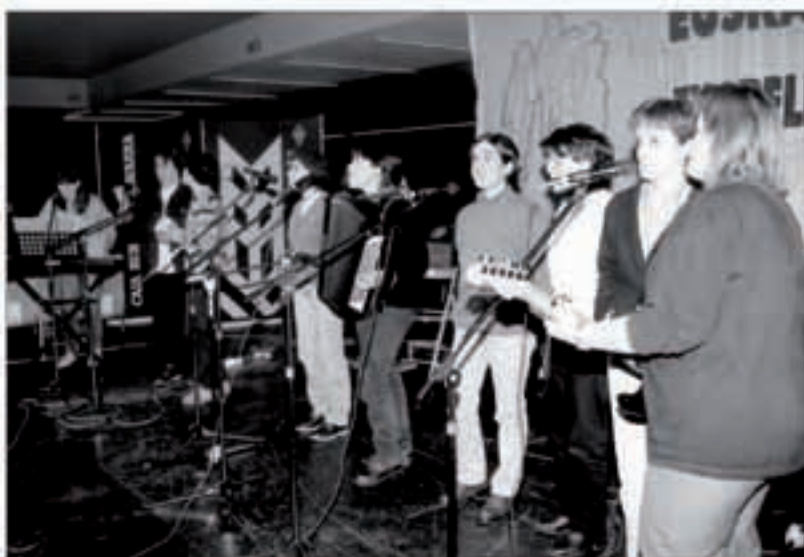
Duela bortz urte Doneztebeko kantariak izan ziren Euskal Kantu txapelketako finalean.

Abenduaren 16an Bordatxo dantzalekuan egingen da Nafarroako Euskal Kantu txapelketaren finala. Arratsaldeko 4,30etan hasiko