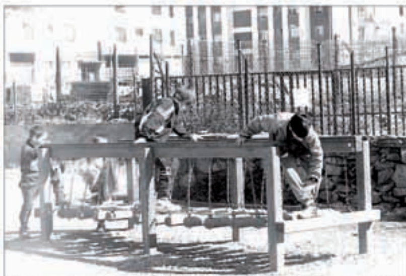
Hiru begirale behar dira haurrentzako aisialdi tailerrak antolatzeko Eguberrietan. Hemezortzi orduko programa aurkeztu behar dute.

Abenduaren 2an, gaztain eta talo afaria egiten da, gaueko 9:30etan, Torrean. Ondoren trikitilariak eta txiste kontalariak izanen dira. 2.500 pezeta ordaindu beharko da eta txartelak hartzeko azken eguna abenduaren 1a da.