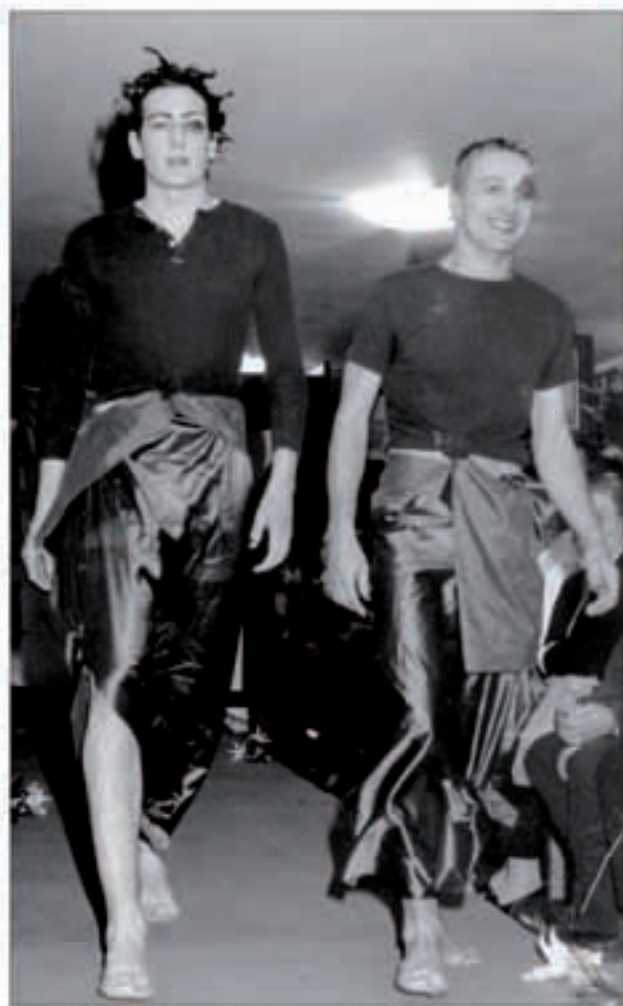
Herriko edo hurbileko modeloak ikusteak xarma berezia ematen die desfileei.

kualdeko erosleek Nafarroatik kanpo egindako erosketetan, gastatutako guztiaren %14, hain zuzen. Hone-laxe ageri da Ernst & Young enpresak, Nafarroako Gobernua Merkataritza Garbarari emandako mandatua betez egindako txostenean. Gehienek Irunera jo zuten (%58) eta bertze %20ak Donostia aukeratu zuten. Baztan eta Leitzaldetik batzere Iruñera joaten direnak gehitzen baditugu, kontuak garbi daude: eskualdeko dendetatik kanpo egiten den erosketak kopurua gero eta handiagoa da. Joera hori baretzeko zenbait kanpaina egiten ari dira gure dendariak. Joan den urtean, «Hemen bizi, hemen erosi» kanpaina burutu zuten