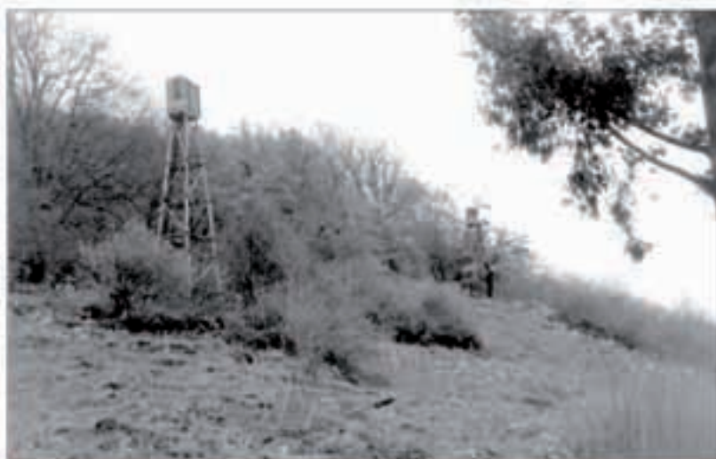
Joan den urtean Lekunberriko usategiak bisitatu zituzten usozaleek.

Ohitura zahar bati jarraikiz, Euskal Herriko uso ihiztarien elgarretaratzea ospatuko da aurten ere. Denetan 9 sare toki badira: 7 Ipar Euskal Herrian, bat Biarnoko Lanne herrian (Xiberuako mugan) eta azkena Etxalarren. Urte guziz Euskal Herriko uso ihiztariak biltzen dira, herri desberdin batean aldizka, ordre alfabetikoa segituz. Gan den urtean 120 presuma Baxe Nafarroako Lekunberri bildu baziren, aurten Sarako aldi izanen da. Larunbat huntan, abenduaren 2an, elgarretaratuko dira. Goizean herriko usotegietan zer aldaketa izan diren ikusteko bisita egin eta, aperitifa han berean hartuko dute. Gero Omordia gelan bazkalduko dute, usotegietan kondaketa egingen dutelarik. Agian bertzeetan Saran baino gehiago atxeman dituzte, bertzenaz pentsatzekoa da zenbaketa uste baino fiteago egingo izanen dela!