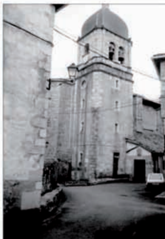
Harri pikatua legarrarekin garbituko da eta ate eta leiho inguruetan harri pikatua paratuko da.