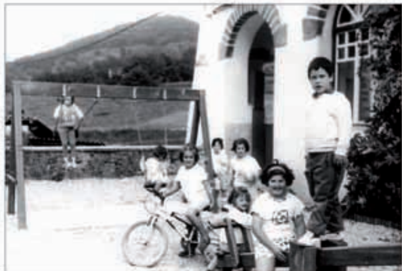
lazko ikasturtean baino ume bat gehiago dago aurten eskolan. Arbizbon

aterpea berritzen hasi dira. Lehengoa bota eta leku berean egingo dute. Ondean, telefono kabina egingo dute.