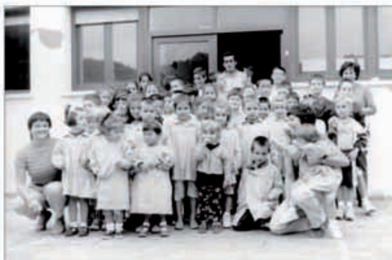
Hemen daude eskolako ikasle guztiak. Batzuk kontent, besteak triste baina denak eskolan.

Buruilaren 2an hasi zen aurtengo usategietako postuen subastak 8.028.164 pezeta lortu du aurtent. Lehenengo egunean bertan 4.336.000 lortu zen; hasieran motel samar joan bazen ere azkenean emaitza polita ikusi ahal izan zen subastan. Aste beteko epea izan zuten ehiztariek postuei sesta emateko. Lehenengo egunetan bi posturi bakarri jo zitzaizten sesta nahiz eta azkenean hamaka izan ziren sesteatuak. Buruilaren 13an izan zen azken subasta postu hauek behin betiko (aurtengo denboraldirako) adjudikatze-