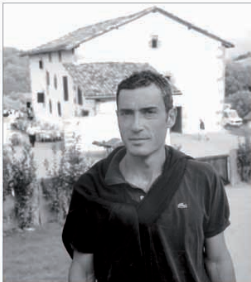
«Horrelako etxe bat egiteko 500 arbol baino gehiago behar ziren botatu».