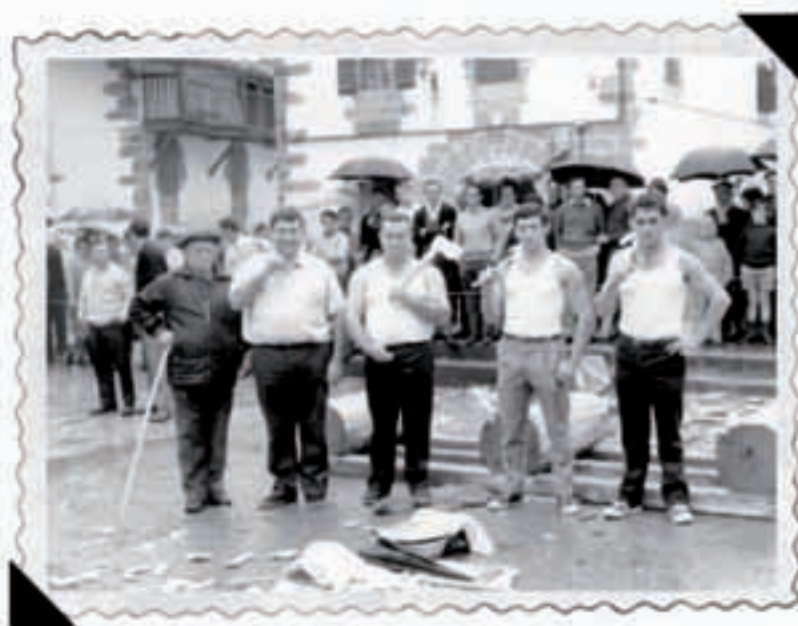
Garai batean herritarren arteko aizkora apostuak egiten ziren. Aurten, igandean Mindegia eta Larretxea eta Arrospide eta Olasagastiren arteko apostua ikusteko modua izanen da.

Igandea, urriak 1 Goiz eta arratsaldez haur parkea. 1etan aizkora apostua; Mindegia eta