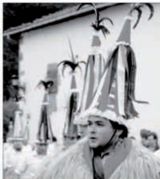
Joaldunak izanen dira berriz ere protagonista larunbat honetan.

3etan herri bazkaria eginen da Herriko Etxeko sabaian, honako menu honekin: Garbantzuak eta mailarra, bakailua, txuleta, tarte eta txanpaina, kafea, kopa eta puna. Bazkarirako txartelak Iturengo ostatu eta dendetan eros daitezke 3.500 pezetatan. Bazkal ondotik, arra-