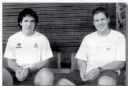
Egunaria 00ko irailak 3

«Ez, hainko dieta berezirik ez dugu egiten. Gauza bakarra: orain hartzen dugu (makarroiak eta), baina ez dugu erregimen zorrotzik betetzen, zorionez. Eta jan, denetik jaten dugu. Haragia eta arraina... gehiena orca eta gutxiena, barazkia».