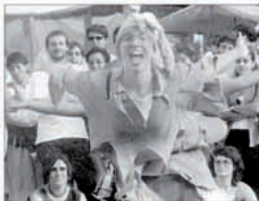
Karrika antzerkia, eskulanak eta bertze halbat gauza ikusgai izan ziren Santiago Bidearen Azokan.