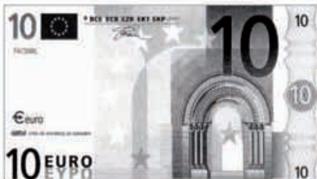
2002ko urtarrilaren 1etik aitzinera euroak erabiliko dira soilik.

2002. urteko martxoaren 31 bitarte luzatu dute bi-leteen aldaketa egiteko epea. Honek erran nahi du Europako Batasuneko Banku Zentral bakoitzak bertze herrialde-