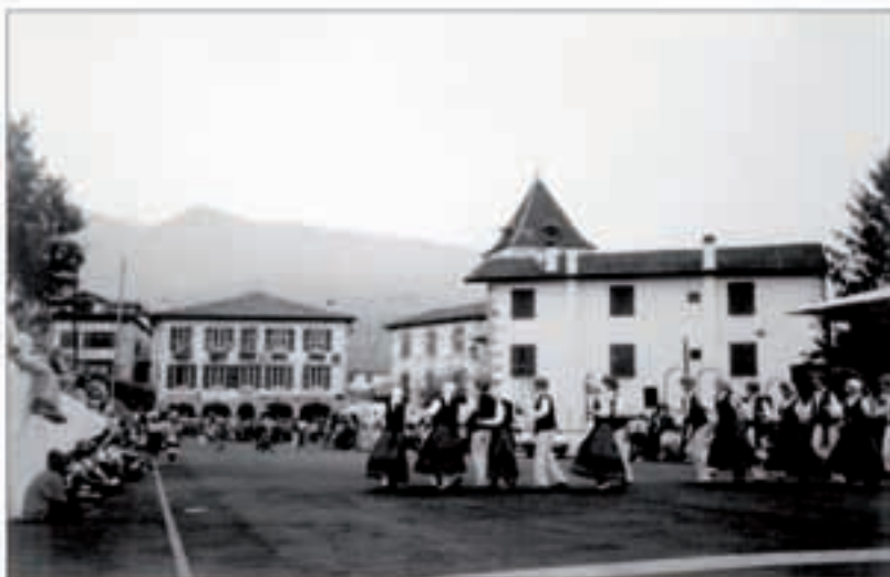
Dantzariek ere eskaini daukute beraien saio ikusgarria Sarako bestetan.