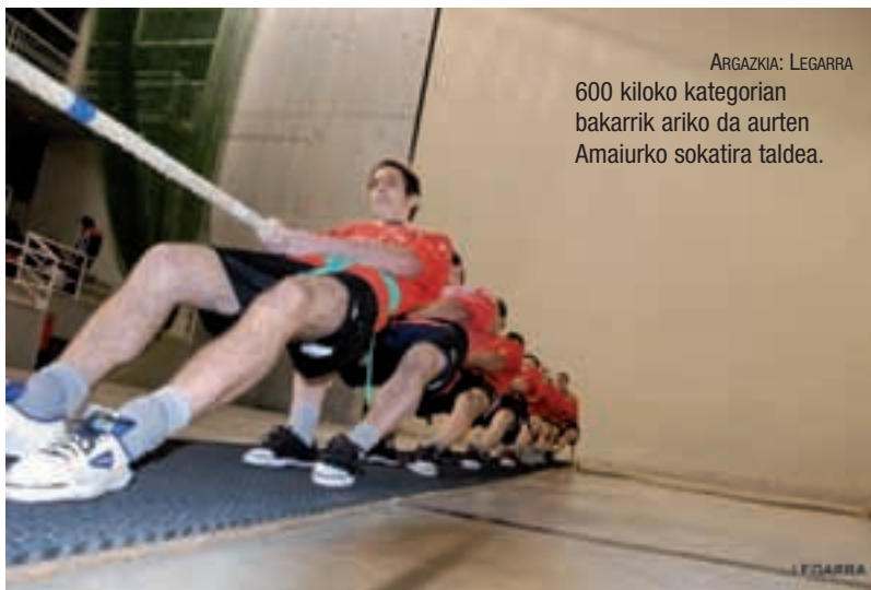
600 kiloko kategorian bakarrik ariko da aurten Amaiurko sokatira taldea.

Amaiurrekin batera bertze hameka talde ari dira pisu honetan: Ibarra (Gipuzkoa), Abadiño A eta B (Bizkaia), Ñapurak (Ezpeleta, Lapur-