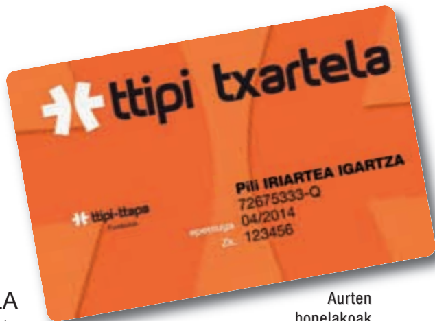
Aurten honelakoak izanen dira txartelak

TTIPI-TTAPA laguntzeak badu saria. TTIPI TXARTELA dutenek badituzte deskontuak gure herrietako hainbat dendetan, %25eko desgrabazioa Errenta-Aitorpenean, hamabostero zozketak eta... aldizkaria etxean hartzea Txartelaren prezioan sartua dago.