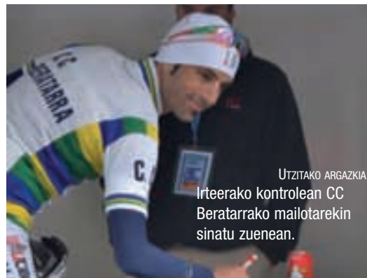
Irteerako kontrolean CC Beratarako mailotarekin sinatu zuenean.