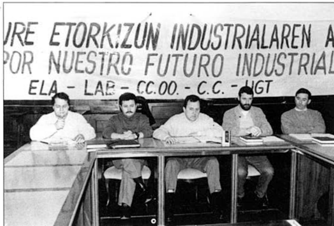
Sindikal Batzordeak martxoaren 3ko bileran eman zuen ezagutzera bere eritzia 4 puntuko agiri baten bitartez

Horren arabera, mozioa aurkeztu zuen Herrialde taldeak "ez ditu ezagutzen Siderurgi Integralaren arazoak", hala ere, "bere eremuko industriaren mantentze eta indartzean lehenetsuzko edozein proiektu kontutan hartzeko eskubidea aitortzen diogu Udalari -dio sindikal Batzordeak aintzinarago- bertzeek burutzen ari diren plangintzetan sartzea ez den bitartean". Guzti horregatik "mozioa atzera bota eta eskualdeko Industri Alkateen Batzordearekin hartutako konpromezuak bete ditzan" eskatu dio Sindikal Batzordeak Berako alkateari, "ahalegin bateratze eraginkor batez AHV sendo dadin Siderurgi Integrala bezala orokorrean eta «Lesakako Laminategiak»