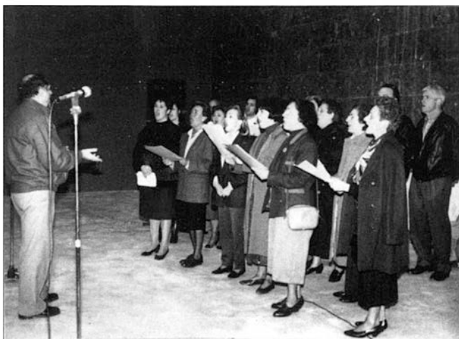
Musika banda eta zuzendariari omenaldia eginen zaie

IKEI erakundeak ikerketa lan bat egin du muga ondoko herriek eta eskualdeek Europar sartu eta Merkatur bateratua jartzean zer eragina jasoko duten