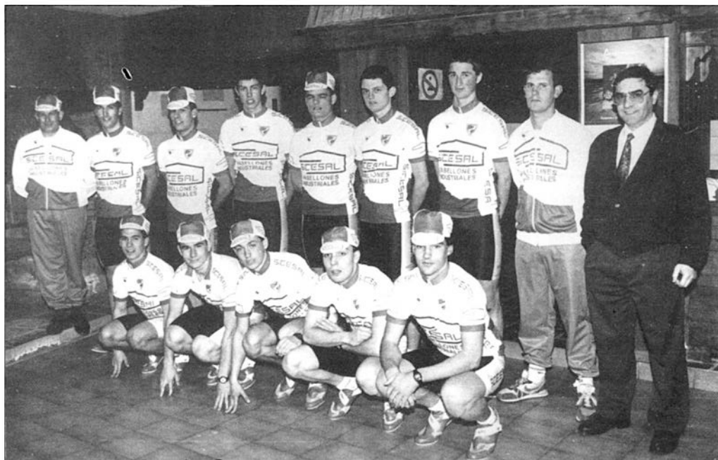
19 eta 20 urte bitarteko Nafarroako eta Gipuzkoako txirrindulariek osatzen dute Beti Gazte - Sicesal bigarren mailako afizionatuen txirrindulari taldea