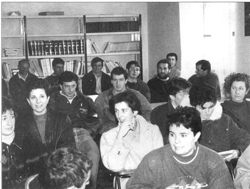
Gehien bat Baztango jendeak eman du izena kurtsoan, baina baita ere Malerreka, Bortziriak, Bertizarana, Sunbilla eta Urdazubiko gazteek.

Iazko Irailean hasita datorren Apirila bitarte, eskualdeko 50 gazte inguru ari dira Oronotz - Mugairiko San Martin eskolan, abelzantzari buruzko zenbait kurtsoan parte hartzen. Hilabetero, aste batez, baserriko lanak goizean goiz bukatu eta laisterka eta presaka ailegatzen dira eskolara, bertan irakasleen esplikazioak jasotzeko. Kurtsoak, ITGk antolatzen ditu, Nafarroako Gobernua eta INEM erakundearen babesaz, eta jende alde-tikan, behinpein, izugarritzko arrakasta izan dute aurtengoan.