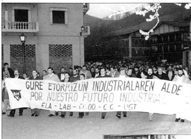
ELA, LAB, CCOO, CC eta UGT sindikatuak konbokatutako martxoaren 7an egindako manifestazioa

Manifestariak, Erosle ondotik aterita, Bittiria, plaza, Arretxea, Albistur eta Plaza Berri karriketarik barrena ibili ziren, Plaza Zaharrean bukatuz ibilaldia. Bertan, AHV itxtearen aurka zonalde guztian egindako firma bilketa kanpainan baten berri eman zen baita hurrengo egunetan egindako mobilizazioetan (bertzeak bertze Madrilen) parte hartzeko eskaria luzatu zen. Ondoren irakurritako idatzian, “Laminacionesek 1.800 langile enplegatzen ditu, baina gainera eragin handia du zonaldeko ekonomiarekiko, bertan ari diren lan-