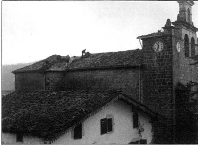
Eskertzekoa izan da jendearen parte hartzea teilatua moldatzeko auzolanean

Lan guztietarako aurrekontua 3 miloi t'erdikoa da gutti gora behera, honela banaturik: teilatua moldatzea, 800.000 pzta; argia berritzea, 200.000 pzta; pinturalana, 1.200.000 pzta eta erretabloaren garbiketa, 1.100.000 pzta. Sarre- rak berriz, leku hauetatik