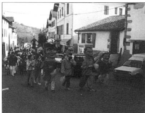
Leitzako buruhandiak ibili ziren Sarako Inauterietan