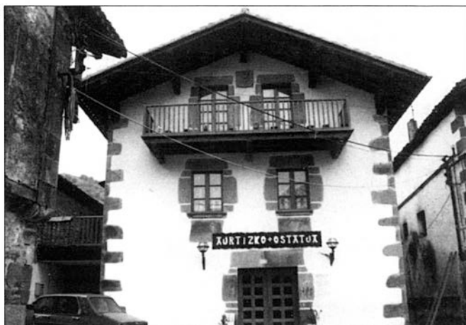
Aurtizko ostatuaren kontratua moztu egin da

Martxoaren 1ean, 15 egunetako denbora ematen zitzaion Aurtizko ostatuan ostalari zirenei, lokala desalojatzeko. Honela ostalaria eta udala akordiora ailegatu dira, eta udalak, 300.000 pzta ordaintzeko