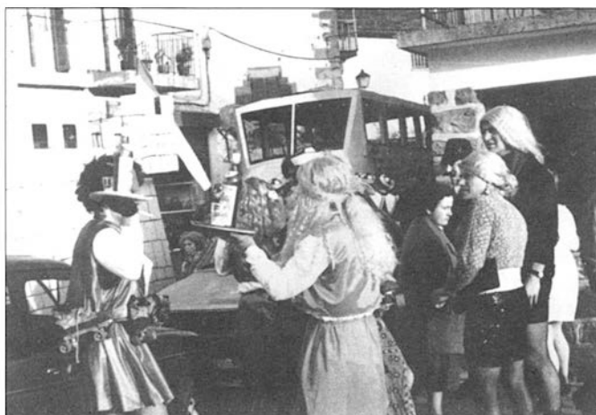
Gero eta Inauteri ederragoak ditugu Donezteben. Aurtengoak umore ederrean igaro ziren eta era guzietako disfrazak ikusteko aukera ere izan genuen. 5.000 pezetako lehen saria, Gorbatxov eta Felipe Gonzalezen mozorroak irabazi zuten.

Lan kontuekin segituz, INEM-en laguntzaz, urtero egin ohi den bezala, aurt