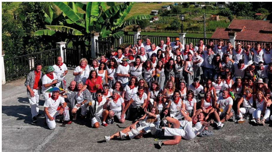
Baikorrek peñako kideak joan den urteko peña eguneko bazkariaren ondotik, Koxkontako atarian.

646 774 117 www.talleresjoisa.com talleresjoisa@hotmail.com Otsango Ind. 31770 LESAKA