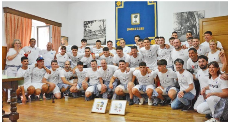
Erreka eskubaloia eta Doneztebe futbol taldeek piztu zuten iaz suzuria. ALICIA DEL CASTILLO

09:30ean diana gaiteroekin. 10:00etan plater tiroa Bordablankan. 11:00etan ongi etorria eginen diote Udal Ttikari eta haurren txupinazoa. 11:30ean kalejira erraldoi eta buruhandiekin herrian barna eta Dantzari Ttikien ikuskizuna Bear Zanan, ondotik luntxa dantzariantzat. 12:00etan bertso saioa Santa Luzia plazan: Maialen Lujanbio, Xabat Illarregi eta Joanes Illarregi. 13:00etan batukada herrian barna. 14:00etan Udal Ttikiko haurren bazkaria eta gazte bazkaria Santa Luzia plazan, Burrunbak antolatua. 16:00etan puzgarriak Bear Zanan. 18:00etan Züttik eletrotxaranga herrian barna, eta aldi berean Emakume Master Cup San Fermin pilota tomoearren finalaurrea Ezkurra pilotalekuan. 20:00etan A Toda Madre Santa Luzia plazan. 22:15ean suzko zezena Bear Zanan. 00:00etan Biziraun Santa Luzia plazan.