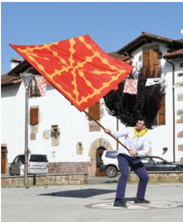
Plazan banderarekin dantzan. ONDIKOL

10:00etan diana herriko txistulariekin. 11:00etan haurren pilota partidak Txarutaren eskutik. 12:00etan erraldioak herrian barna. 16:00etan zaldi ikuskizuna Lamiarrietan Ordoki Zalditegiaren eskutik. 18:00etan dantzaldia Olgetan erromeriarekin. 20:00etan mutil dantzak eta gaita. 22:00etan Txapela Brava, 00:00etan Olgetan erromeria eta 02:30ean Txabas DJ. Afaltzeko bokatak izanen dira.