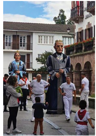
Herriko bestetan ia egunero aterako dira.

Helduak ez dituzte albo batera utzi eta azpimarratu dute proba egiteko aukera edonork duela, adin eta sexu mugarik gabe: «Badakigu, kanpotik ikusita, jende aunitzi gibelera botatzen diola dantzan ez jakiteak, baina hona etorri eta probatuko balute, ikusiko lukete errealtatea bertzelakoa dela». Izan ere, taldean ikasten dute erraldoiak eraman eta dantzarazten: