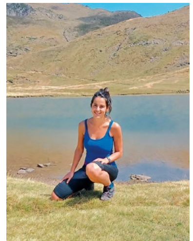
lax hartu zuen alkatetzat Jaurenak.

Herrian ikusten duen «beharrak handienetako bat» da haurrendako parkea: «Arizkun gaur egun ez dugu parkerik, eta orain eskolako patioa handitzeko aukera ailegatu