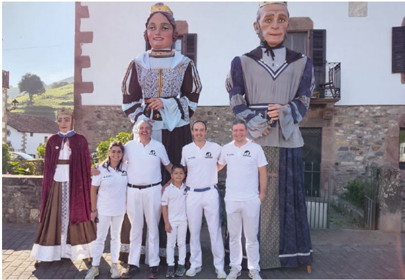
Konpartsako kideak eta hiru erraldoiak.

astean pare bat aldiz elkartzea hobe izaten da, dena ahalik eta hobekien lotzeko». Entsegu horietan erraldoiak txandakatzen dituzte: «Batzuek hauek sorbaldan dituztela dantzatzan duten bitartean, bertzeek erraldoi gabe entsegua egiten dute».