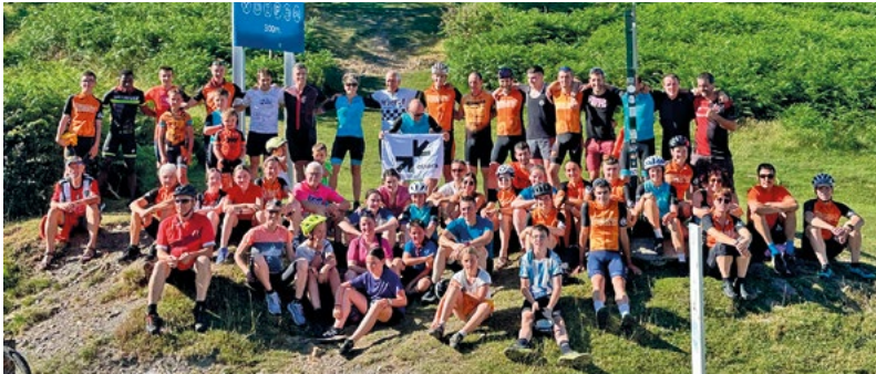
Eguraldi ezin hobea izan zuten joan den urtean Izpegiko igoeran.

10:00etan diana herriko gaiteroekin. 11:00etan meza nagusia. 12:00etan herriko dantzari ttipien emanaldia izanen da plazan eta ondotik mutil dantzak eta luntx herrikoia. 16:30ean mus txapelketa. 20:00etan Destino Sonora mariatxien emanaldia, eta mojitoak ere izanen dira. 21:30ean mutil dantzak, gaita eta larrain dantza. 22:30ean pintxaldi irekia.