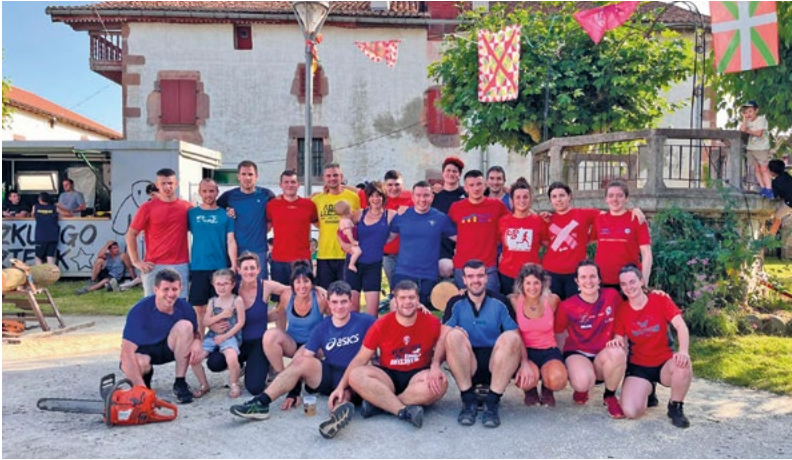
Giro ederra izan zuten joan den urtean herri kiroletan. UTZITAKOEA