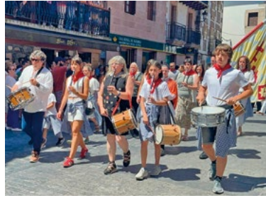
Txistulariak San Pedro egunean. A. DEL CASTILLO