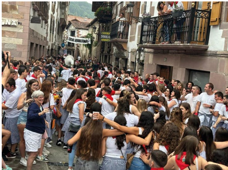
Karrikako giroa nabarmendu du Iribarrenek. ALICIA DEL CASTILLO