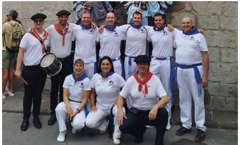
Konpartsako kideetako batzuk iaz San Pedro Egunean.