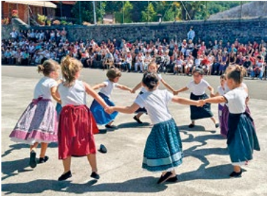
Dantzari ttikien emanaldia. A. DEL CASTILLO