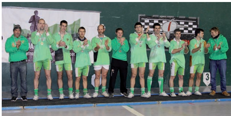
Beti Gazteko tiralariak podiumeko bi koxka gorenetan, Euskal Herriko launakakoan.

Bizkaiako Murueta A taldeak osatu zuen podiuma, Gipuzkoako Ibarra A laugarren izan zen, Murueta B bosga-