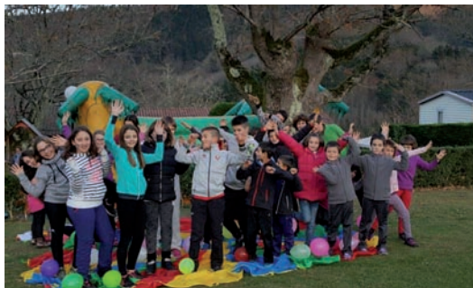
Neska-mutikoak haurren jokoetan.

jokoak akitu eta txokolatada eder batez gozatzeko aukera izan zuten. Ondoren bingoan jokatu zuten. Guzti honen ondotik afari eder batez gozatzeko aukera izan zen giro ezin hobean. Hauspolarari taldearen musikarekin kantuan eta dantzari ibiltzeko aukera bikaina.