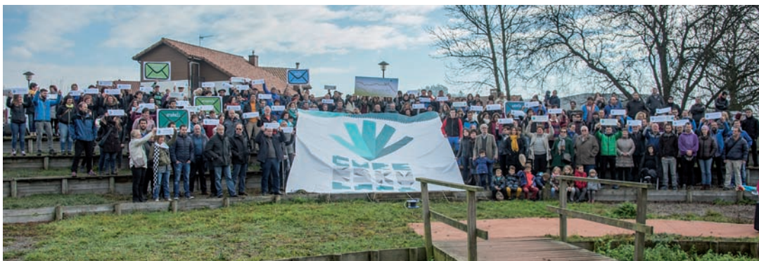
ARGAZKIA: GURE ESKU DAGO

Horretarako, 16 urte-rik gorako biztanleen %10aren babes behar dute Leitzan eta Lekunberrin eta %15ekoa gainontzeko udalerrietan. Babes hori sinaduren bidez adieraziko da eta bi hilabetez Goizue-